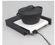
※写真のIH調理器・鍋は別売りです