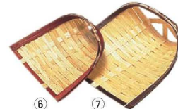
竹 珍味入れ (薬味入れ)