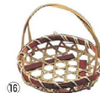
竹つる付 珍味入れ