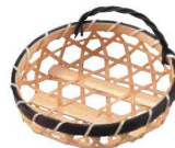
⑫竹 青六ツ目 カズラ付 珍味入れ