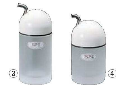
③しょう油さし (L) ㊦