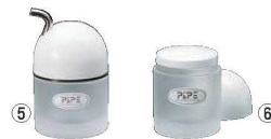
⑤しょう油さし (S) ㊦