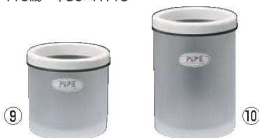
⑨スタンド (S) ㊦