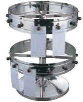
③EBM 据置用 オーダークリッパー 2段式