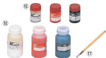
⑰ ACカラー用筆ACF ㊦