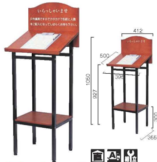
① ウエイティングスタンド ㊦