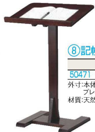
⑧ 記帳スタンド古代色 ㊦