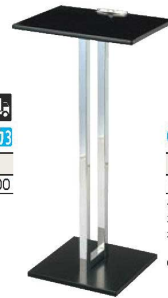
⑨ えいむ テーブル型記名台 ㊦