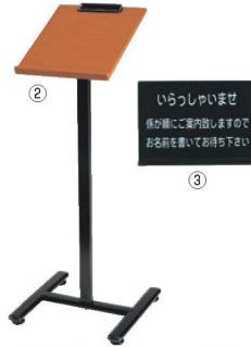
② えいむ 記名台 ㊦