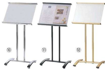
えいむ サインスタンド SS-100 ㊦