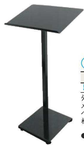
⑦ 記名台 ㊦