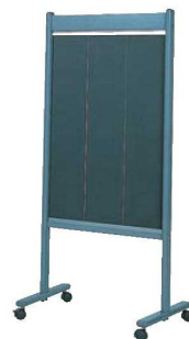
⑬ 歓迎板 ㊦