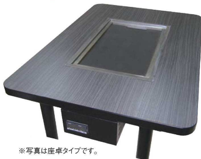
※写真は座卓タイプです。