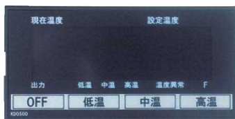
オリジナル開発のデジタル式温度調節器

温度設定:切替式(強・中・弱) ●鉄板の表面温度を素早く均一に保つ「鉄板重層加熱方式」です。 ●鉄板表面温度が180℃になっていても、周囲のガードフレームの温度を50℃以下に保つ特殊構造