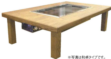
※写真は和卓タイプです。