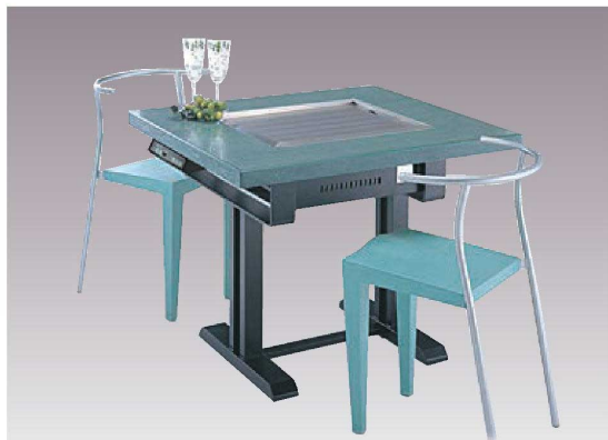
※写真は洋卓タイプです。