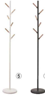
ボールハンガー プレーン 71