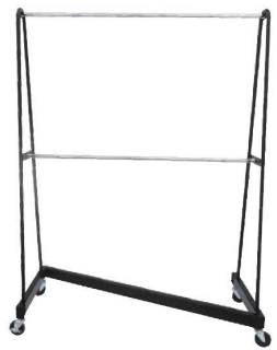
⑪ Zハンガーラック ハングハンダ 74

外寸:1,500×600×H1,500 材質:ベース縦パイプ/黒塗装 ポール/クロームメッキ ●キャスター付