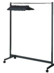
⑫ コートハンガー 74

外寸:1,500×600×H2,000 材質:ベース縦パイプ/黒塗装 ポール/クロームメッキ ●キャスター付