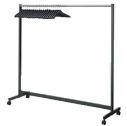
⑬ コートハンガー 74

外寸:1,280×515×H1,570 材質:スチール 重量:13kg ●脚形状/T字脚 脚仕様/スチール角パイプ(粉体塗装) 床接点仕様/キャスター 本体/スチール角パイプ(粉体塗装) ●フレーム/角パイプ、粉体塗装 ●キャスター付 ●追加ハンガー/HN-S1D:注文は5本単位で承ります。