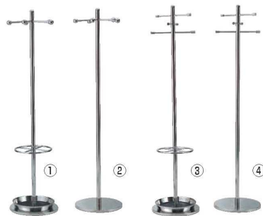
EBM 18-8 コートハンガー 回転式 71