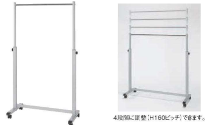
コートハンガー スライドタイプ 74

外寸:280×280×H1,770 重量:5,300g 材質:本体/スチール(粉体塗装) キャップ/PE、木棒/天然木 台座/PP ●木製のバーとスチールを組み合わせたナチュラルでスタイリッシュなボールハンガー ●バーの先端は帽子や繊細なストールを直接掛けても傷つけない