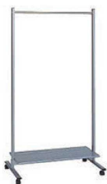
⑭ コートハンガー 74

外寸:1,680×515×H1,570 材質:スチール 重量:14kg ●脚形状/T字脚 脚仕様/スチール角パイプ(粉体塗装) 床接点仕様/キャスター 本体/スチール角パイプ(粉体塗装) ●フレーム/角パイプ、粉体塗装 ●キャスター付 ●追加ハンガー/HN-S1D:注文は5本単位で承ります。