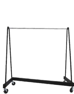
⑩ Zハンガーラック ハングハンダ 74

材質:フレーム/スチール角パイプ(シルバー粉体塗装) ハンガーパイプ/スチール丸パイプ(クロームメッキ仕上げ) キャスター/φ50mmPA樹脂(前輪スッター付)