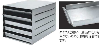
タイプAと違い、底面に切り込みがないため小物類を保管できます。