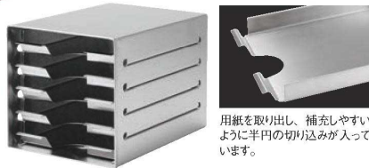
用紙を取り出し、補充しやすいように半円の切り込みが入っています。

EBM おすすめ オール18-8ステンレスで衛生的!! チップしないので食品工場での異物混入防止対策に最適!!