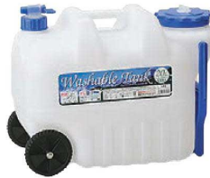
⑥ ウォッシュャブルタンク キャスター付20ℓ