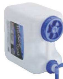
⑦ ウォッシュャブルタンク Nタイプ レバー式コック付