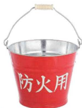
⑬ 防火用バケツ 8ℓ