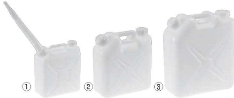
水缶（ポリタンク）ノズル付き