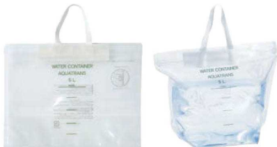
⑩ 折りたたみバケツアクアトランス 17