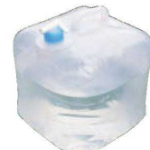
⑫ 折りたたみポリタンク 20ℓ

外寸:使用時/225×225×H270 折りたたみ時/200×200×H60 材質:ポリエチレン、ポリプロピレン ●収納時かざらない折りたたみ式ポリタンク ●懸水時などに便利です。