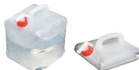
⑪ 折りたたみポリタンク 10ℓ

容量:5ℓ 外寸:約280×340 材質:ナイロン、ポリエチレン ●開口部に特殊構造のチャック「エクシール」(特許取得)を使用し、水濡れしにくく、安全で丈夫な多層フィルムを使用しています。 ●運搬に便利な手さげ付きで、折畳むとコンパクトになります。