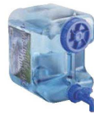
⑧ ウォッシュャブルタンク ポリカ 12ℓ 蛇口式コック付