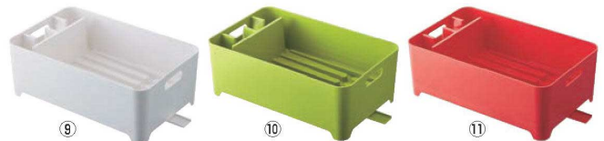
水切りバスケット アクア

材質:本体/鉄(クロームメッキ+樹脂コーティング) トレイ/着立て/排水口/ポリプロピレン 止水栓/シリコンゴム 脚/塩化ビニル樹脂 ●排水・止水が切り替えできるシリコン栓付 ●自在に動く可動式排水口