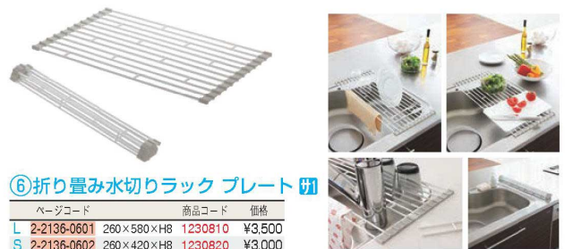
⑥折り畳み水切りラック プレート

※列の間隔:3cm 下の足がスライドする為、大・中・小兼用です。 ※クリーンバスケットA型B型(①~④)にご使用できます。