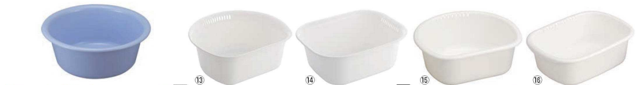
⑫アシスト 洗桶 ブルー