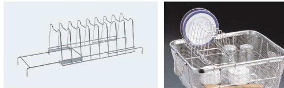
⑤ビクトリー 18-8 クリーンバスケット用 皿立てスタンド