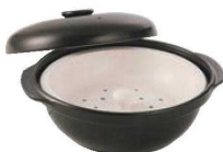
セラミック製蒸し板付