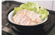
蒸し板を使って蒸し鶏と野菜蒸し