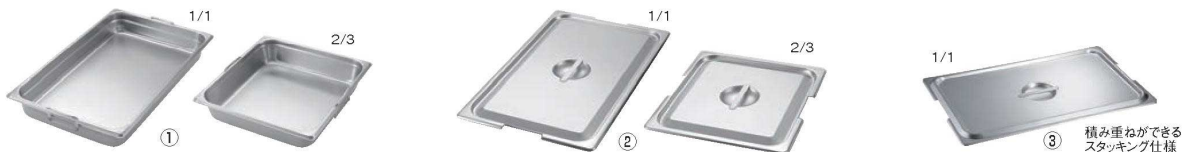
① 18-8 テーブルパンII フック(取手)付