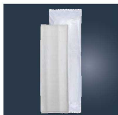
⑫パール不織布おしぼり 平型 超大判 (70本入) 350×265

材質:パール不織布 ●両手を覆う超大判で貴族な使い心地 ●温めても冷やしても使えます。