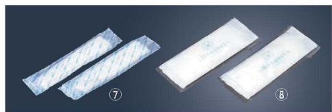
⑦紙おしぼり エレガンス ロールタイプ (1,000本入)