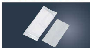
⑬パールフィルム おしぼり (2,000本入)