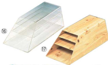
⑯アクリル 経木差し