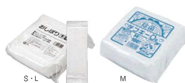
⑨平型おしぼり テフキーオースリー (100枚入)