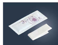
⑭ミニおてふき C型 (400枚入)

200×200 1ケース:100本×20袋 原反:スパンレース(レーヨン)60g素材