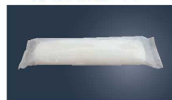
⑩使い捨ておしぼり エマーブルフリー 丸型大判 (700本入)