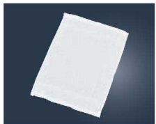
②EBM タオルおしぼり No.80 (12枚入り) ホワイト