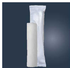
⑪パール不織布おしぼり 丸型 超大判 (50本入) 350×295