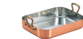
⑪ ムヴィエール 銅 ロティール 2155