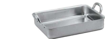
③ マトファー / ブウジャ 18-10 手付 ローストパン7135