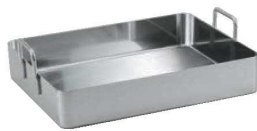
① デバイヤー イノックス ローストパン 3121

Check! ローストパン・ロティールの用途、使用方法 西洋料理に使われ、ロースト(蒸し焼き)する、ポイルする、オーブンで焼く、大量食材の下ごしらえ、角型なので大容量の調理に適しています。大きい食材を切らずにそのまま調理できるのも利点の1つです。深型にスノコを合わせれば、蒸してそのまま取り出せます。