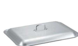
⑥ アルミ 浅型 ローストテンパン 専用蓋