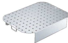
⑦ アルミ 深型 ローストテンパン用 スノコ