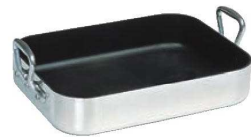
⑧ ムヴィエール シルバーストーン ロティール 9850