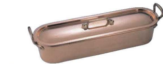
⑬ ムヴィエール 銅 ポワソニエ 2160