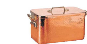
⑫ ムヴィエール 銅 プレザール 2153