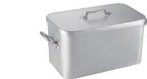
⑩ ムヴィエール アルミ プレザール 1111