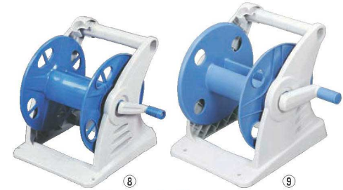
ホースリール (空リール) ジュニアス

(ホースφ12 30m付) 外寸: 394×400×H400 (ハンドル含む) ホース耐寒温度 / 0℃、耐熱温度 / 60℃ ●水流を用途に合わせて8通りが選べるノズルを使用