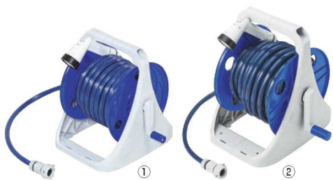
ホースリール Gアクア