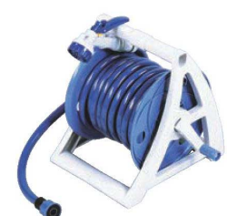
⑤ホースリール オーシャン 15 NPR15GN

ホース耐寒温度 / 0℃、耐熱温度 / 60℃ ※マルチスプレー、3点ピスト式ホースコネクター付 ●直射日光を防ぐのでホースの劣化を防ぎ、ホースが長持ちします。 ●ホースを巻取ると、貯めた水の中をホースが通りながら巻かれ、ホースに付着した泥などが洗浄されます。