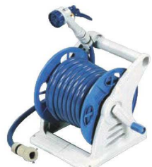
⑥ホースリール ジュニアス20 Gノズル GR20GNF

(ホースφ12 15m付) 外寸: 290×325×H330 ホース耐寒温度 / 0℃、耐熱温度 / 60℃ ●水流を用途に合わせて8通りが選べるノズルを使用