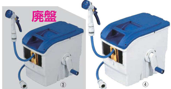
ホースリール ウェイビーボックス