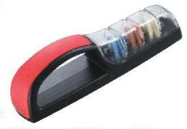
⑰セラミック ウォーターシャープナー

No.440用スベア 2個台紙付 2-0315-1602 8857310 ¥2,500