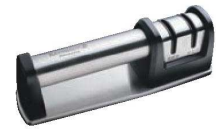
⑧ケブンハウン シャープナー

外寸:215×58×H70 重量:160g 材質:本体/ABS樹脂 粗研スロット/ダイヤモンド 仕上スロット/酸化アルミニウムポリマー 両刃ナイフ用 ※セラミック庖丁、和庖丁(菜切、刺身、出刃など)、ハサミ、工具などは研ぐことができません。