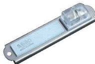
⑥ツウウェイ シャープナー

外寸:145×50×H40 両刃ナイフ用 材質:本体/ABS樹脂 砥石/セラミック砥石 ●庖丁の材質を問わずご使用いただけます。