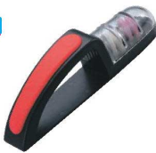
⑯セラミック ウォーターシャープナー

No.220用スベア 2個台紙付 2-0315-1502 8857210 ¥1,950