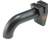
③ツヴィリング 庖丁とぎ器

外寸:136×55×H50 両刃ナイフ用 砥石:工業用ダイヤモンド ●ダイヤモンド砥石を採用することで、金属製(ステンレス、銀、チタン)の庖丁だけでなく、セラミックナイフも研ぐことができます。 ●砥石の下にパネを設置することで、パネが余分な力を吸収し、刃を傷つけにくく、最適な力で研ぐことができます。 ●溝に庖丁を入れてゆっくりと数回手前に引くだけで、簡単に研ぐことができます。