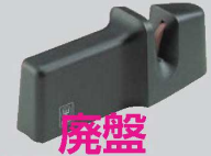
④ヴォストフ シャープナー