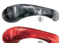
ビクトリノックス 2ステップナイフシャープナー