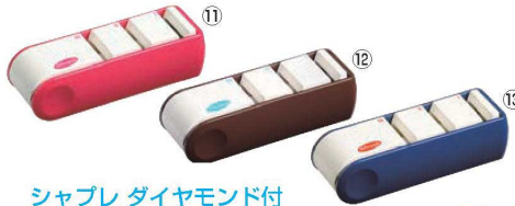
シャプレ ダイヤモンド付 トリプルシャープナー