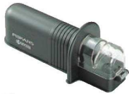
①京セラ セラミック ロールシャープナー