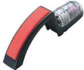
⑮セラミック ウォーターシャープナー

庖丁研ぎを簡単に、且つ安全にできると絶賛され、現在65ヵ国以上で販売されています。