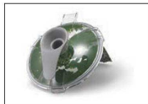
ブrikサーでほうれん草をペースト状にした直後