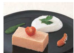
食材を個々に処理した後