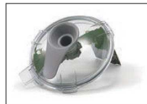
スクレーパーを回転(手動)させると処理物を掻き落とすことができます。