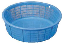
②リス PP 丸カゴ No.55 切