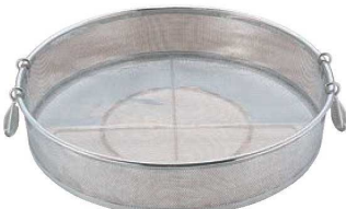
⑪UK 18-8 パンチング 手付 蒸しザル