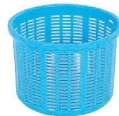
⑧サンコー 万能バスケット 2型(浅型) 切