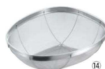
⑭エイブル 18-8 籠ザル