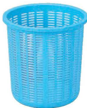
⑦サンコー 万能バスケット 1型(深型) 切