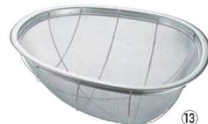
⑬BK 18-8 籠ザル