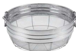
⑩18-8 取手付 広巾ザル(ミゾ付)