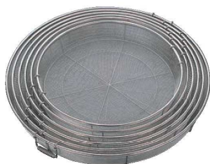
⑫BK 18-8 給食用手付 蒸しカゴ