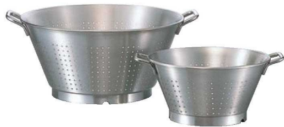
① マトファー/ブウジャ 18-10 イノックス コランダー 7132