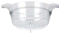
⑪ ガイオ コランダー 5ℓ