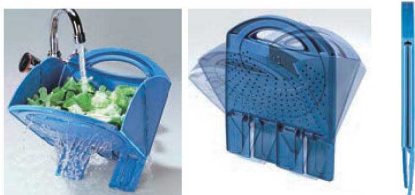
⑭ スコラ・トゥット (折りたたみ式水切り)

耐熱温度:-40~250℃ ●水を切った、そのままレンジにも入れられる便利な水切りボール ●折りたたむので収納にも大変便利