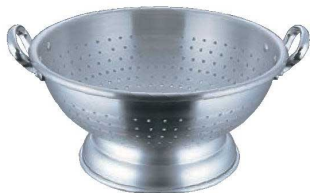
④ アルミ コランダーボール