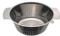
③ レズレー 18-10 ユニカルコランダー