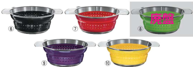
レズレー フォータブルコランダー 24cm