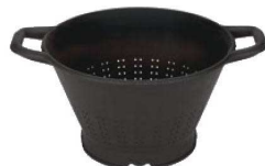
⑤ バデルノ PAプラス コランダー