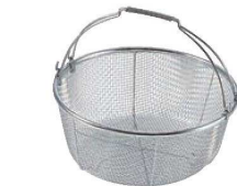
⑮ 18-8 手付丸型洗いカゴ (荒目)