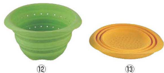
シリコンおりたたみ水切りボール