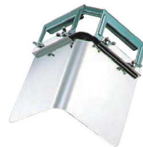
③ステンレス Vカッター S-0076 ㊦

ページコード 商品コード 価格 2-0465-0201 6200000 ¥14,500 外寸:210×100×H230 柄:ステンレス鋼 刃:ハイカーボステンレス鋼 ●安全ガイドカバー付です。 ※9ℓ及び18ℓ角缶の開缶専用です。