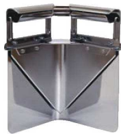
②オールステンレス Vカッター (S) S-0083 ㊦

ページコード 商品コード 価格 2-0465-0101 8055200 ¥21,500 外寸:210×100×H290 柄:ステンレス鋼 刃:ハイカーボステンレス鋼 ●安全ガイドカバー付 ●柄も強靱に強いステンレススチール製 ●刃が鋭シヤープなので少ない力で開缶できます。 ※角缶18ℓの開缶専用です。