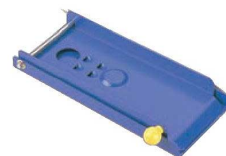
⑪缶つぶし機 リサイクルクラッシャー 踏み踏み ミニタイプ RC-2M

ページコード 商品コード 価格 2-0465-1001 0944900 ¥108,000 外寸:420×1,300×H675 重量:47kg 対応空き缶:18リットルまでの缶 材質:鋼板製 ●移動用キャスター付