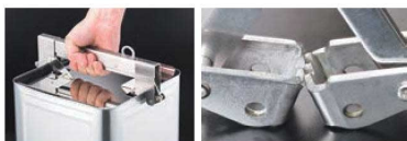
⑧安全ロック機能付 1斗缶ハンガー ㊦

ページコード 商品コード 価格 2-0465-0801 4252100 ¥22,000 外寸:300×230×H110 (安全ロックレバー解除時はH155) 材質:18-0 ステンレス鋼 ●中身の入った9ℓ缶・18ℓ缶を安全に持ち運ぶのに 便利な缶ハンガー