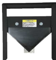
⑤鉄 一斗缶カッター ㊦

ページコード 商品コード 価格 2-0465-0401 6199900 ¥5,800 外寸:210×100×H290 柄:刃:鉄 ※18ℓの角缶用です。