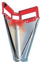
④鉄 Vカッター カバー付 S-0082 ㊦

ページコード 商品コード 価格 2-0465-0301 0739400 ¥8,800 外寸:210×100×H230 柄:鉄 刃:ステンレス ※9ℓ、18ℓの角缶用です。