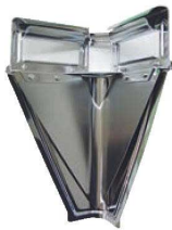
①オールステンレス Vカッター (L) S-0085 ㊦

ページコード 商品コード 価格 2-0465-0101 8055200 ¥21,500 外寸:210×100×H290 柄:ステンレス鋼 刃:ハイカーボステンレス鋼 ●安全ガイドカバー付 ●柄も強靱に強いステンレススチール製 ●刃が鋭シヤープなので少ない力で開缶できます。 ※角缶18ℓの開缶専用です。