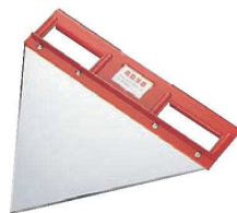
⑨缶つぶし機 スカッター ㊦

ページコード 商品コード 価格 2-0465-0801 4252100 ¥22,000 外寸:300×230×H110 (安全ロックレバー解除時はH155) 材質:18-0 ステンレス鋼 ●中身の入った9ℓ缶・18ℓ缶を安全に持ち運ぶのに 便利な缶ハンガー