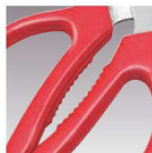
オープナーとして使用できます。