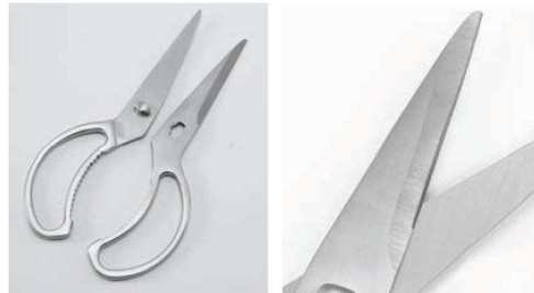
分離できるので洗浄が簡単で衛生的。 細かなギザ刃で食材をキャッチ。すべらず切れます。

分解洗浄ができるので汚れがたまりにくく清潔。 カラーは5色展開なのでアレルギー対策にも対応します。 食材による色分けが可能なので食中毒予防にも使用できます。