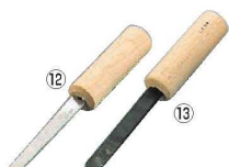
⑫EBM ステンレス ハマムキ