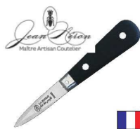
⑦ジャン・ネロン ラ・フルミ オイスターナイフ ブラック