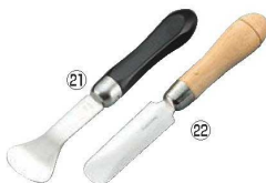
㉑18-8 黒柄 ホタテ貝ムキ