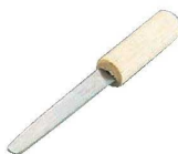
⑯EBM ステンレス ミル貝ムキ