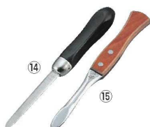
⑭18-8 黒柄 ハマムキ