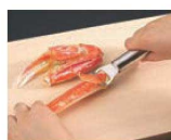
㉓ステンレス カニむき器