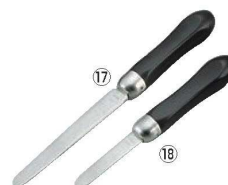
⑰18-8 黒柄 ミル貝ムキ