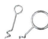
㉕サザエのつぼ焼取り (大小2本セット)