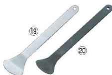
⑲ステンレス 帆立貝ムキ