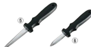
PPオイスターナイフ