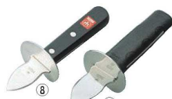
ヴォストフ カキ割り