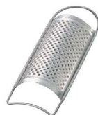
⑪18-8 IKD 抗菌 万能 卸金