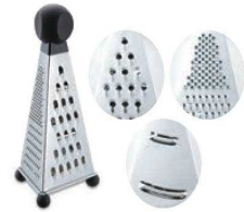
⑥3面チーズグレーター