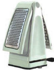
②スティックス グレーター