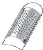
⑩18-0 チーズ卸金 特大