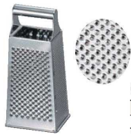
⑦四面 チーズ卸器 大