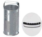
③ブリキ 円筒型 チーズ卸器