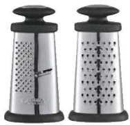
④ボスカ 釣鐘型 チーズおろし