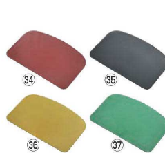
バーキンタ スクレーパー 小

230×118×厚さ2.0 材質:ポリプロピレン、鉄成分 ●金属検出機で検出できる樹脂製のスクレーパーです。