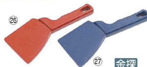
バーキンタ 2 エッジスパチュラ

材質:ポリプロピレン(鉄粉配合) 耐熱温度:80℃ ●金属検出機で検出できる樹脂製のスパチュラです。