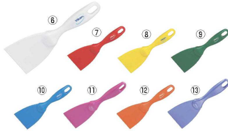
ヴァイカン ハンドスクレーパー 小 4060