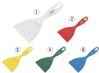
ヴァイカン ハンドスクレーパー 大 4061