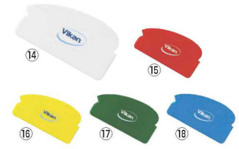
ヴァイカン オリジナルスクレーパー