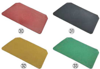
バーキンタ スクレーパー 大