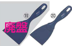
ヴァイカン MDS ハンドスクレーパー