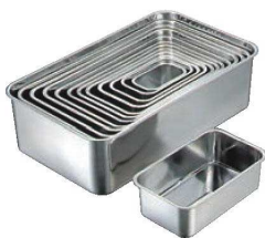
①BK 18-8 深型 長バット