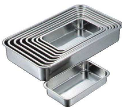
②BK 18-8 浅型 長バット