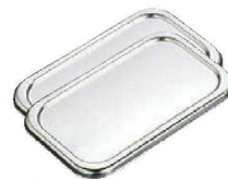
③BK 18-8 長バット蓋