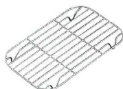
⑤BK 18-8 長バットアミ