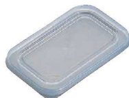
④BK 樹脂製 長バット蓋