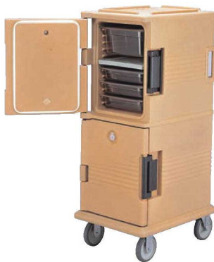
②カムカート (フードパン用) UPC800