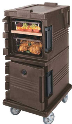
①カムカート (フードパン用) UPC600