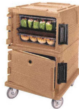
③カムカート (フードパン用) UPC1200