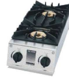
③シルクルーム ガステーブル スペースガッツ SK-5

外寸:738×275×H118 重量:8.9kg 材質:ステンレス、鋳物、樹脂 ●コンパクト設計 ●設置場所の限られた厨房に最適