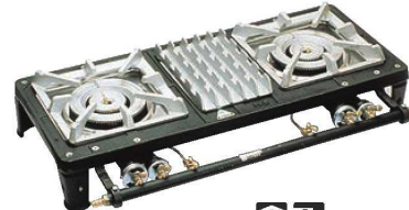
⑥ガステーブルコンロ MD-702L (2連大)