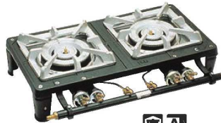
⑤ガステーブルコンロ MD-702 (2連)