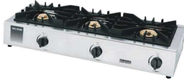
②シルクルーム ガステーブル ガッツNo3 SK-3

外寸:542×275×H118 重量:6.5kg 材質:ステンレス、鋳物、樹脂 ●コンパクト設計 ●設置場所の限られた厨房に最適