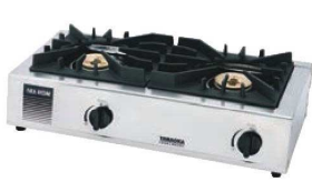
①シルクルーム ガステーブル ガッツNo2 SK-2