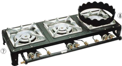
⑦ガステーブルコンロ MD-703 (3連)