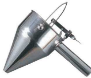
④EBM 18-8 片手 種落し