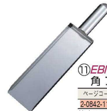
⑪EBM 18-8 角 アンサン