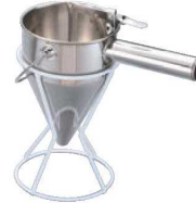
⑥種落し用スタンド