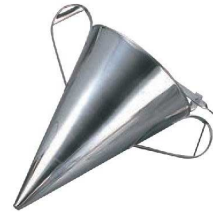
③EBM 18-8 種落し