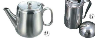
⑱K 18-8 蝶番付 ラムポット