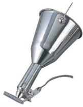
①EBM 18-8 チャッキリ