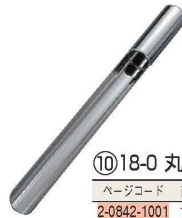
⑩18-0 丸 アンサン