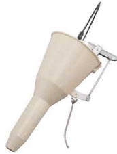
②PC チャッキリ 洗