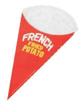
⑮三角ポテト袋 (3,000枚入)