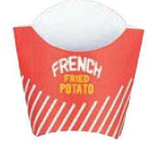
⑭フレンチポテトカートン 01384 (50枚入)