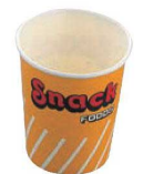
⑯スナックカップ 7オンス 黄 03020 (80枚入)