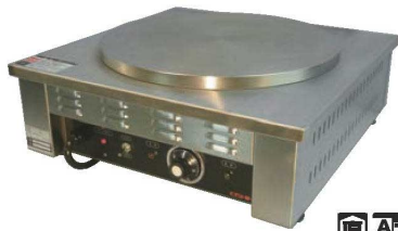
エイシン 電気 クレープ焼器 (一連) ㉔

57 屋台・イベント調理機器 50 濃度計他 51 炊飯器・スーフシャヤ 52 電気・ガスコンロ 53 焼アミ 54 オーブレンジ・電子レンジ 55 低温調理器・フードウオーマ 56 お好み焼・たこ焼・鉄板焼関連