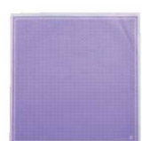
⑩クレープ包装紙 デリシャス (四角) 200枚入 パープル