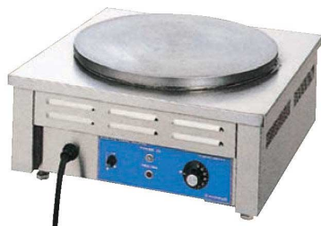
電気 クレープ焼器 ㉔