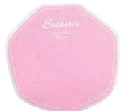
⑨クレープ包装紙 デリシャス (変形) 200枚入 ピンク