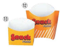
⑫スナックカートン 黄