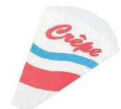
⑪クレープ袋 01461 (2,000枚入)