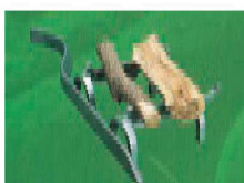
図のように使用するとより効果的です。