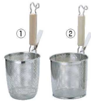
①UK 18-8 パンチング 木柄 丸底 うどんテボ