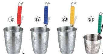
UK 18-8 シリコン柄 カラーハンドルてぼ