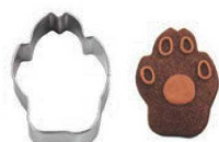
㉕18-8 クッキー抜型 ドッグフット