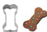
㉖18-8 クッキー抜型 ドッグボーン