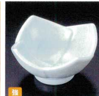
12528-579 風車小鉢 (青磁) 600円 150人 (8.2×8.2×4.7cm)