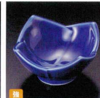
12529-579 風車小鉢 (青) 600円 150人 (8.2×8.2×4.7cm)