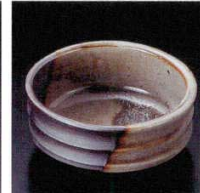
12516-269 ネズミ志野切立ケズリ小鉢 660円 120人 (8.4×3.6cm)