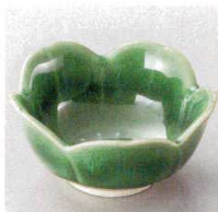
12532-199 緑釉花形小付 380円 200人 (8.8×4cm)