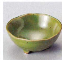
12534-139 緑釉斑点三ツ足小付 290円 200人 (8.4×4cm)