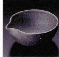
12509-669 南蛮3.0片口鉢 (信楽焼) 1,000円 250人 (9.5×9×4cm)