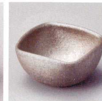
12506-669 黒窯変角小付 (信楽焼) 950円 150人 (8.2×8.2×4.5cm)