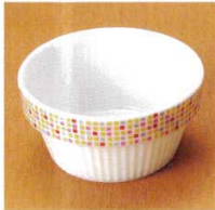
12507-449 モザイクスタック小付 1,050円 160人 (8.2×4.2cm)