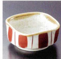
12521-239 赤太十草角珍味 (大) 850円 120人 (8.3×4cm)