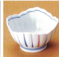
12522-739 錦十草花菊型小付 (有田焼) 700円 5×48人 (8.5×8×5cm)