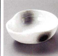
12510-139 白黒吹ひさご型鉢 950円 180人 (9.5×8.6×3.4cm)