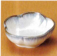
12525-439 ウツメ型小付 480円 150人 (8.3×3.1cm)