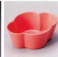
12530-279 マットピンク雲型小付 530円 150人 (8.5×6.7×3.6cm)