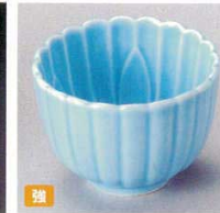
12512-439 トルコ菊型丸小鉢 880円 100人 (8.5×6.2cm)