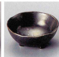
12536-139 いぶし黒結晶三ツ足小付 290円 200人 (8.4×4cm)