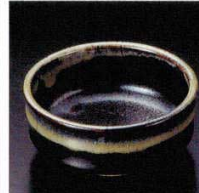
12515-269 白均窯切立ケズリ小鉢 660円 140人 (8.4×3.6cm)