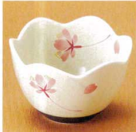
12513-739 桜の舞小付 (有田焼) 900円 10×16人 (8.5×6.5×5.6cm)