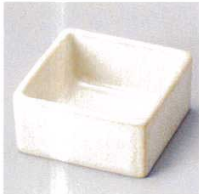
12519-279 シルバーキューブ 730円 240人 (7.5×7.5×3.5cm)