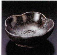
12526-459 伊賀梅型小付 480円 120人 (8.5×3cm)