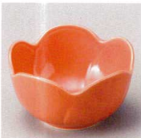
12531-109 梅朱赤小鉢 460円 150人 (8.3×4.7cm)