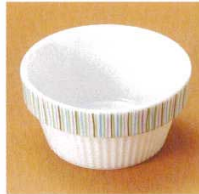
12508-449 ストライプスタック小付 1,050円 160人 (8.2×4.2cm)