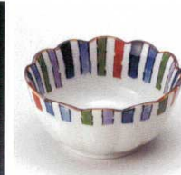
12518-739 錦十草小付 (有田焼) 980円 10×48人 (8×4cm)