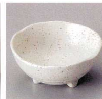
12535-139 粉引三ツ足小付 290円 200人 (8.4×4cm)