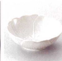
12504-739 ざくらコツケ (消墨) (有田焼) 1,300円 5人 (8.5×3cm・50cc)