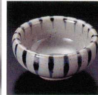
12511-459 トルコサ丸小付 820円 120人 (8.3×4cm)