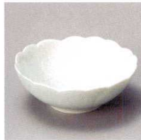
12502-739 ざくらコツケ (青磁) (波佐見焼) 1,300円 5人 (8.5×3cm・50cc)