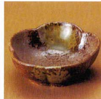
12527-439 信楽梅型小付 480円 150人 (8.3×3.1cm)