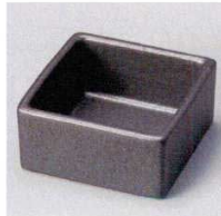
12520-279 マットブラックキューブ 730円 240人 (7.5×7.5×3.5cm)