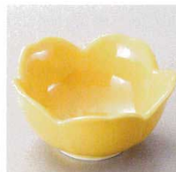
12533-199 黄釉花形小付 380円 200人 (8.8×4cm)