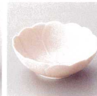
12505-739 ざくらコツケ (桃釉) (有田焼) 1,300円 5人 (8.5×3cm・50cc)