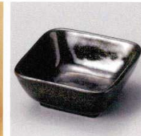
12524-579 金彩天目8.5cm角小付 450円 130人 (8.5×8.5×3.7cm)