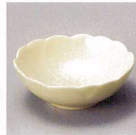
12503-739 ざくらコツケ (黄磁) (波佐見焼) 1,300円 5人 (8.5×3cm・50cc)