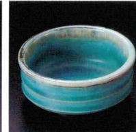
12517-269 トルコブルー切立ケズリ小鉢 660円 120人 (8.4×3.6cm)