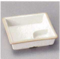
14740-059 洲サビほかし仕切付角鉢 850円 90入 (11.4×11.4×3.4cm)