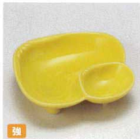
14717-579 仕切松花堂 Y 1,300円 100入 (13×13×3cm)