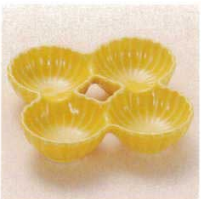
14739-439 黄菊型四品皿 920円 150入 (11.7×2.8cm)