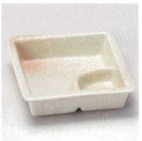
14741-239 ピンク吹仕切松花堂 650円 80入 (11.5×11.5×3.2cm)