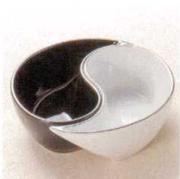
14727-179 プラチナブラック勾玉珍珠 1,100円 300入 (10.5×6.5×3.5cm) 14728-179 プラチナホワイト勾玉珍珠 1,100円 300入 (10.5×6.5×3.5cm)