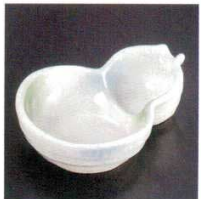
14718-559 二彩吹ひさご小鉢 1,080円 80入 (12.8×9.7×3.6cm)