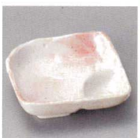
14724-319 白タキ角仕切鉢 950円 70入 (11×11×3.2cm)