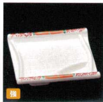
14705-559 赤絵グリーン竹笹仕切皿 1,480円 100入 (11.3×11.3×2.5cm)