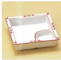
14701-419 赤絵格子正角仕切鉢 1,950円 72入 (11.8×11.8×3.4cm)