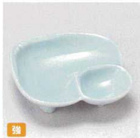
14716-579 仕切松花堂 青磁 1,300円 100入 (13×13×3cm)