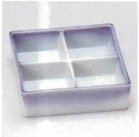
14736-149 紫吹四ツ切角鉢 1,850円 60入 (11.3×11.3×3cm)