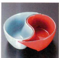
14725-179 プラチナブルー勾玉珍珠 1,100円 300入 (10.5×6.5×3.5cm) 14726-179 プラチナレッド勾玉珍珠 1,100円 300入 (10.5×6.5×3.5cm)