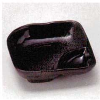
14702-589 備前灰釉仕切鉢 1,780円 100入 (11.3×2.8cm)