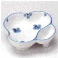
14714-189 梅型梅仕切鉢 1,280円 60入 (13.3×11.8×3.5cm)