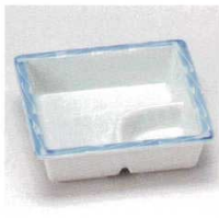
14708-109 染付一珍仕切付鉢 1,100円 80入 (11.5×3.5cm)