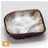
14709-579 備前志野仕切鉢 1,380円 80入 (11.3×11.3×3.5cm)