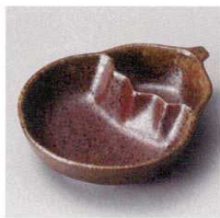
14711-139 あずき釉ナス型仕切鉢 1,050円 100入 (13.8×11×3.2cm)