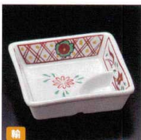
14720-189 赤絵万歴仕切付四角鉢 1,100円 60入 (11.5×11.5×3.3cm)