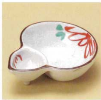
14703-419 春菊瓢型仕切鉢 1,650円 80入 (12.7×11.1×3.6cm)