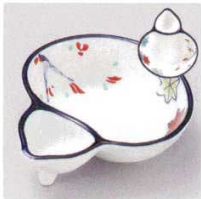
14715-189 春秋ひさご千代久付鉢 1,360円 60入 (13×11×3.5cm)