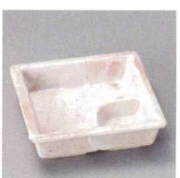
14735-059 桜吹き仕切付角鉢 850円 90入 (11.4×11.4×3.4cm)