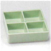
14737-149 ヒツ釉四ツ切り角鉢 1,650円 60入 (11.3×11.3×3cm)