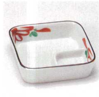
14713-419 春菊なで角仕切鉢 1,650円 72入 (11.5×11.5×3.2cm)