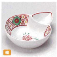
14712-189 赤絵万歴仕切付ひさご鉢 1,100円 60入 (13×11×3.5cm)