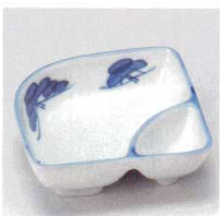
14721-139 扇形松画仕切鉢 1,250円 80入 (11.2×11.2×3.8cm)