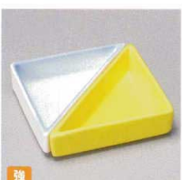
14729-559 吹付ルリ三角松花堂 1,030円 (10.8×15.3×2.9cm) 14730-559 レモン三角松花堂 980円 (10.8×15.3×2.9cm)