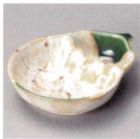
14710-139 志野織部ナス型仕切鉢 1,280円 100入 (13.8×11×3.2cm)