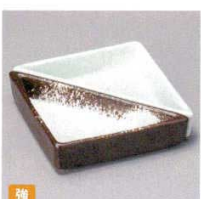
14731-559 青白磁三角松花堂 950円 (10.8×15.3×2.9cm) 14732-559 鉄仙花白吹き三角松花堂 1,030円 (10.8×15.3×2.9cm)