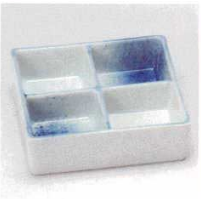
14738-179 吹墨四ツ切角鉢 1,300円 100入 (11×3.5cm)