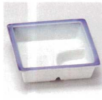
14707-149 紫吹き仕切付角鉢 1,300円 80入 (11.5×11.5×3.4cm)