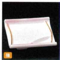
14706-589 ピンク竹笹仕切皿 1,280円 100入 (11.3×11.3×2.4cm)