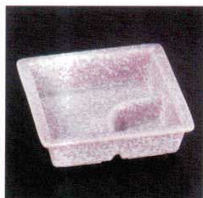
14719-149 雪化粧仕切付鉢 1,300円 80入 (11.6×11.6×3.5cm)