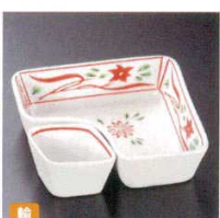
14733-189 赤絵万歴L字鉢 1,100円 60入 (11×3cm) 14734-189 赤絵万歴千代久 330円 150入 (6.5×4.5×3.5cm)