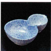
14722-439 吹ズミヒサゴ平鉢 1,100円 150入 (13×9×3.5cm)