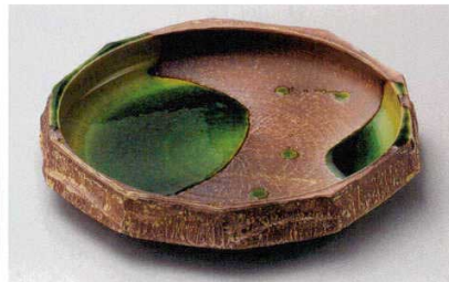
01508-179 錆袖ヒワ流し面取8.0鉢 4,400円 20入 (23.7×4.4cm)