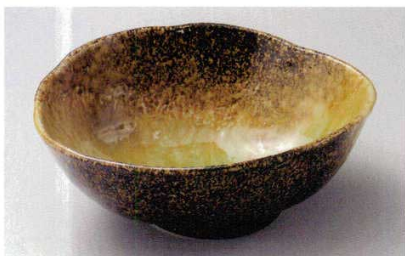
01510-179 岩清水変型大鉢 3,000円 20入 (24×20.5×9cm)