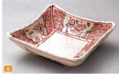
01502-199 志野赤絵盛鉢 12,000円 20入 (23×23×7cm)