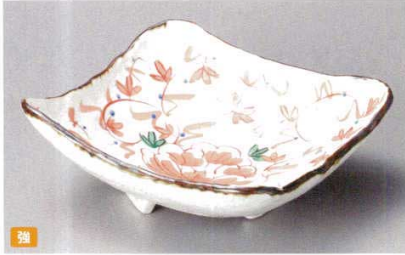
01501-559 牡丹唐草尺角鉢 10,800円 15入 (23.5×22.5×8.6cm)