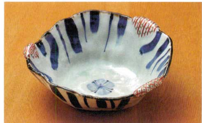
01509-179 赤絵小紋三方なぶり8寸鉢 4,600円 20入 (23.5×27×8.6cm)