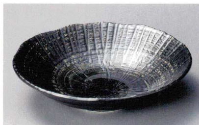
01514-139 黒渦彫十草型23cm盛鉢 1,700円 30入 (23.6×22.4×5.5cm)