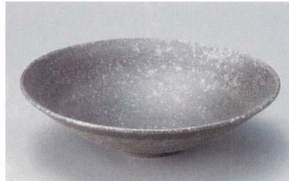
01505-669 黒窯変8.5丸鉢 7,300円 (25.5×7.5cm)