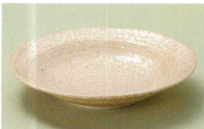
01513-459 黄白野8.0種皿 2,150円 30入 (24×4.7cm)