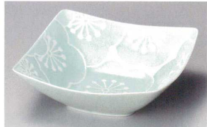
01506-739 はぶり大鉢 (波佐見焼) 6,400円 1入 (22×22×7.5cm)