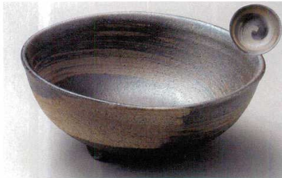
01504-669 刷毛目足付大鉢 (信楽焼) 9,000円 20入 (24×24.5×10.5cm)