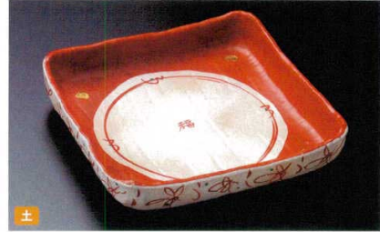
01503-149 赤絵切立盛皿 9,800円 15入 (24×24×5.5cm)