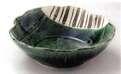
01512-109 織部十草8寸鉢 2,800円 20入 (24×7.8cm)