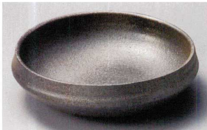
01507-669 炭化8.3ひねり大鉢 6,000円 (26×25×7cm)