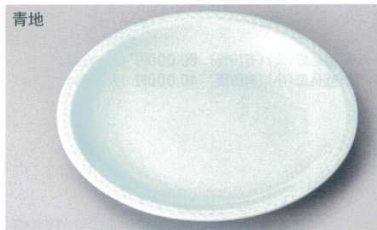
青地 17804-649 10号ダイヤ皿(萬古焼) 2,100円 24入 (32×3.5cm)