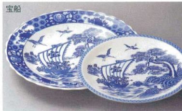
宝船 17822-659 13号雪輪皿(萬古焼) 5,800円 8入 (42×5.5cm)