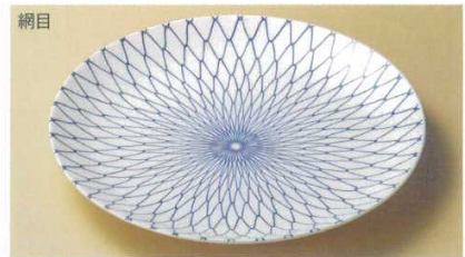
網目 17819-659 13号丸皿(萬古焼) 5,800円 8入 (42.5×5cm)