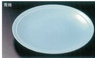
青地 17809-659 高台皿12号(萬古焼) 3,800円 10入 (37.5×5cm)