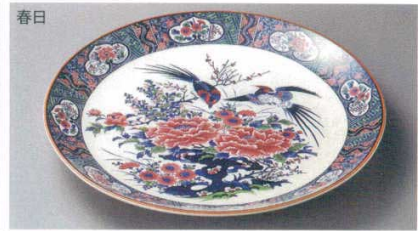
春日 17803-649 13号丸皿(萬古焼) 6,500円 10入 (42.5×5cm)