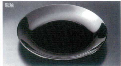
黒釉 17829-649 13号丸皿(萬古焼) 6,500円 10入 (42×5cm)