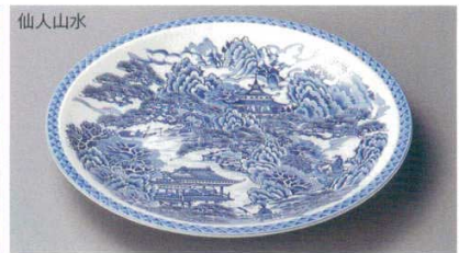
仙人山水 17811-659 12号丸皿(萬古焼) 3,300円 12入 (37×4cm)