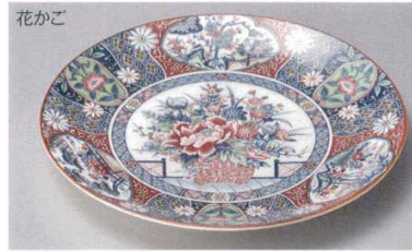
花かご 17802-649 10号丸皿(萬古焼) 2,750円 20入 (32×3.5cm)