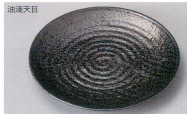
油滴天目 17816-649 11号丸皿(萬古焼) 5,100円 12入 (33.6×3.2cm)