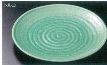
トルコ 17805-649 10号丸皿(萬古焼) 3,300円 18入 (30.3×3.3cm)