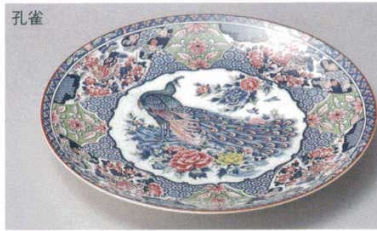
孔雀 17801-649 10号丸皿(萬古焼) 2,750円 20入 (32×3.5cm)