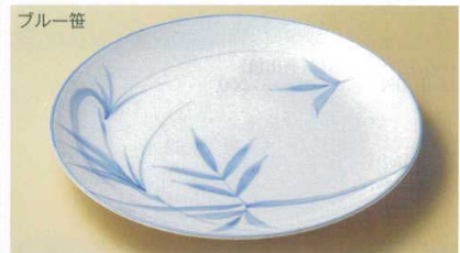
ブルー笹 17806-649 13号丸皿(萬古焼) 5,800円 10入 (42.5×5cm)