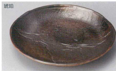
琥珀 17807-659 10号丸皿(萬古焼) 4,500円 15入 (30×4.5cm)