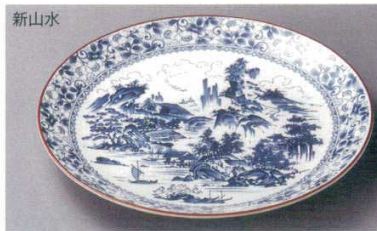
新山水 17813-649 13号丸皿(萬古焼) 5,800円 10入 (42.5×5cm)