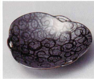
24906-149 唐草銀彩三山前菜皿 3,800円 45入 (20×4.4cm)