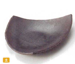
24909-469 黒陶半切三角皿 2,800円 40入 (20×20×5cm)