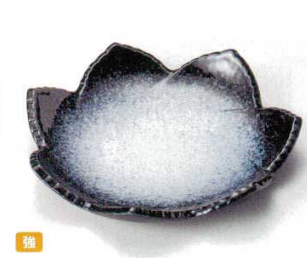
24910-559 雲海葉型6.0皿 2,440円 60入 (18.2×3.2cm)