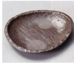
24907-259 炭化ボタモチ繩割6.3寸皿 3,550円 40入 (21×18.5×2.8cm)