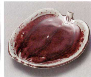
24912-269 辰砂ピーマン皿 2,000円 36入 (20.5×17.2×3.2cm)