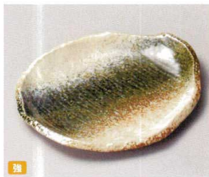
24913-559 緑川変形7.0皿 2,050円 40入 (21×18×2.8cm)