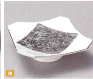
24908-259 白釉和紙変型高台皿 3,100円 40入 (16.5×14.5×4cm)