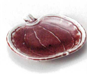
24911-269 辰砂かほちや皿 2,000円 36入 (20.5×19.8×3.1cm)