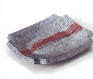
24903-669 暁角切角皿(信楽焼) 4,580円 24入 (19×15.2×3cm)