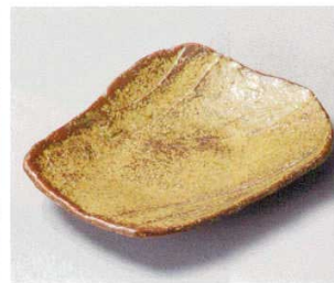
24915-109 不動荒瀬型前菜皿 1,300円 40入 (25×17×3cm)