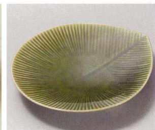
24920-279 MOREオリベ18cm皿 1,050円 60入 (17.5×16×2.5cm)