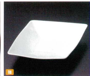
24916-559 青磁変型フルーツ皿 1,400円 60入 (19.1×14.5×3.4cm)