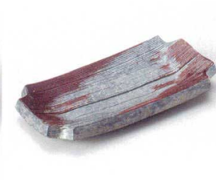
24904-669 暁角切長角皿(信楽焼) 4,100円 36入 (21×10.5×2.7cm)