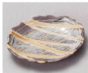
24918-109 乱線白流しソギ入楕円皿 小 970円 80入 (18.3×1.6×3cm)