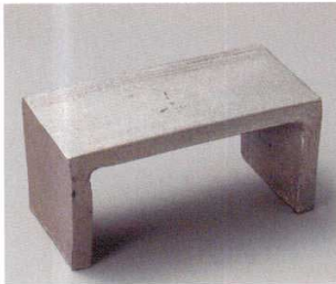
24901-669 黒窯変台皿(大) 7,000円 (20×10×9.5cm)