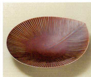
24919-279 MOREアメ18cm皿 1,050円 60入 (17.5×16×2.5cm)