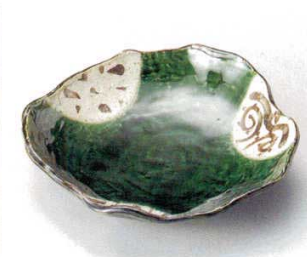
24914-109 織部山里6寸盛皿 1,700円 40入 (19.6×4.6cm)