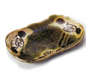
24917-549 織部椿変型焼皿 1,000円 60入 (18×11.5×2cm)