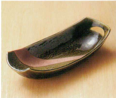
02606-559 織部三角紋長鉢 5,000円 15入 (35.5×15.5×8.5cm)