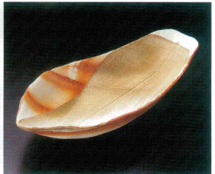
02611-139 緋ダスキ流し朴葉大鉢 4,100円 20入 (43×18×6.5cm)