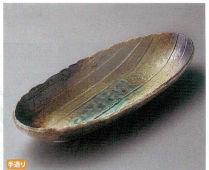
02614-179 和三彩手作り楕円長鉢(大) 3,000円 12入 (39×15.5×6.2cm) 02615-179 和三彩手作り楕円長鉢(小) 1,200円 30入 (28.5×12×5.3cm)