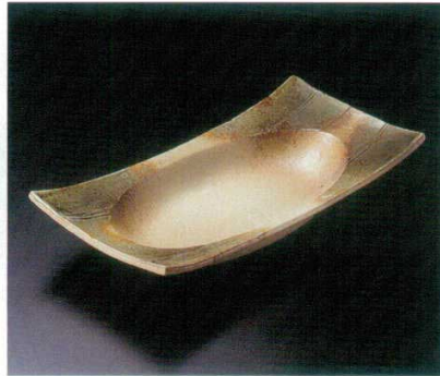
02603-559 伊賀織部12.0寸長角四方楕円鉢 9,000円 15入 (37×18.2×6.9cm) 02604-559 伊賀織部10.0寸長角四方楕円鉢 4,500円 20入 (30.7×15×5.5cm)