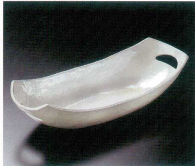
02607-589 真珠長鉢 5,100円 20入 (35×15.3×8.5cm)