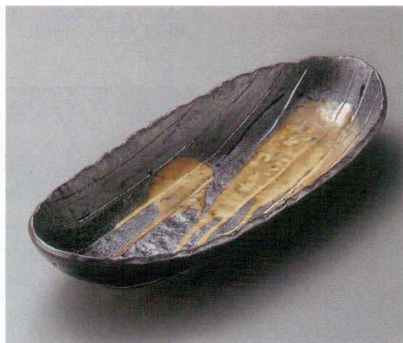
02613-189 流木流しダ円長鉢(大) 3,150円 12入 (39.5×15.3×6cm)