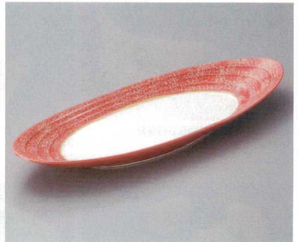
02608-149 金彩赤軸楕円皿 4,850円 40入 (38×13×4cm)