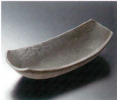
02609-559 炭化土長鉢 4,650円 15入 (34.5×15.8×8.3cm)