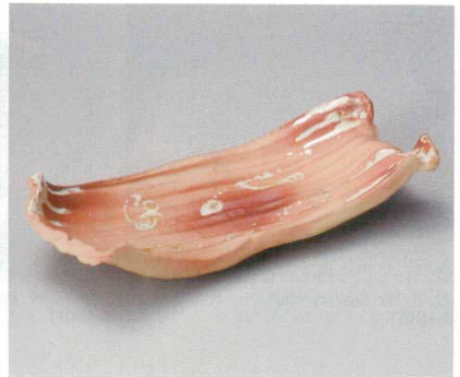
02605-259 焼ゞ灰釉流し尺1寸長皿 5,750円 18入 (35×15×6cm)