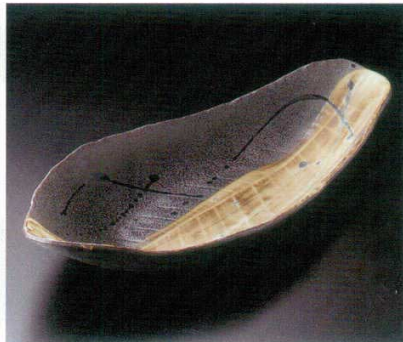
02610-109 流木木の葉大鉢 4,200円 15入 (42.3×18×7cm)