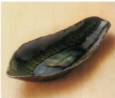
02612-139 いぶし織部朴葉大鉢 4,100円 20入 (43×18×6.5cm)