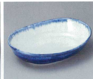
03621-199 デニム21c楕円盛鉢 1,000円 40入 (21×15.5×5.5cm)