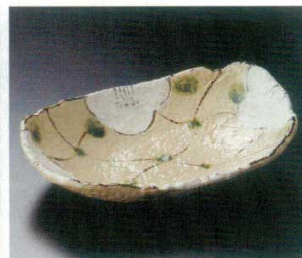
03616-579 山茶花楕円鉢 2,450円 40入 (22×15×4.8cm)