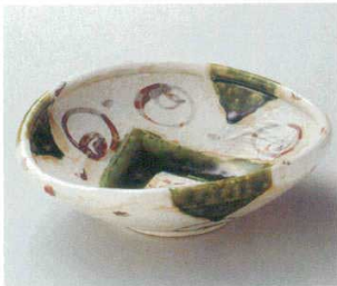
03601-519 織部おもだかたわみ盛鉢 7,000円 20入 (23×22×7cm)