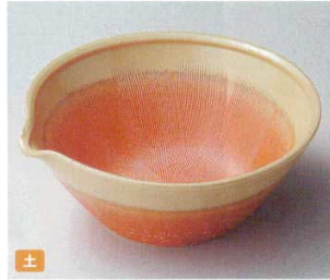
03603-179 伊賀片ロクシメ付7.0鉢 5,100円 20入 (22.8×22×9cm)