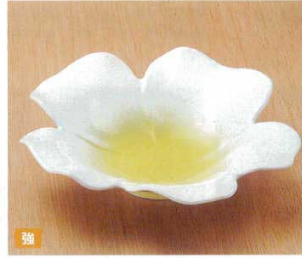
03608-179 イエロー吹花型盛鉢 3,700円 30入 (23×22×5cm)