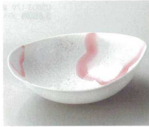
03607-149 ピンクスター変形楕円鉢 3,850円 50入 (22.5×18×7cm)