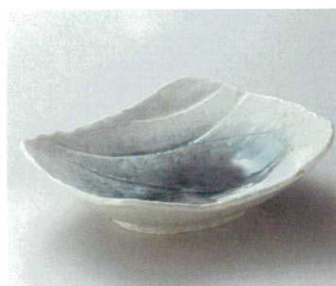
03614-109 湖畔大鉢 2,550円 30入 (22×18×6.5cm)