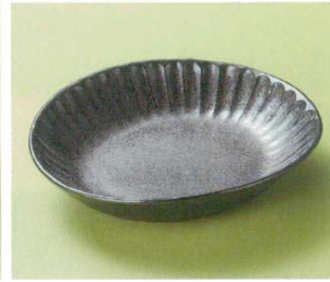
03613-319 ソگیいぶし黒楕円鉢(大) 2,750円 30入 (22.8×21×4.7cm)