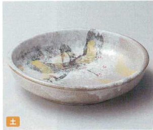
03602-179 桜木7.0盛鉢 5,050円 30入 (23×5cm)