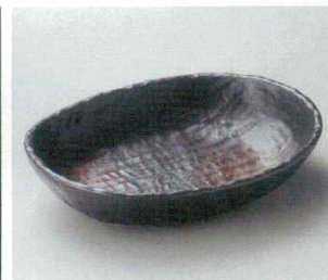
03617-209 黒備前バスケット(大) 1,150円 24入 (22.2×17.1×4.6cm)