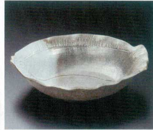
03604-559 天目白吹ひらめ大鉢 4,500円 15入 (25.3×21.5×8.3cm)