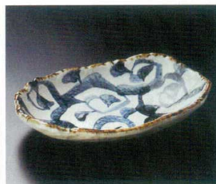
03615-299 新タコ唐草漬物鉢 2,350円 50入 (22×15×4.8cm)