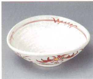
03610-109 粉引赤絵たわみ盛鉢 3,300円 30入 (21×19.5×7.5cm)