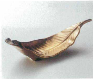
03606-149 黄金釉大葉型前菜 4,500円 50入 (30.5×10.5×8.3cm)