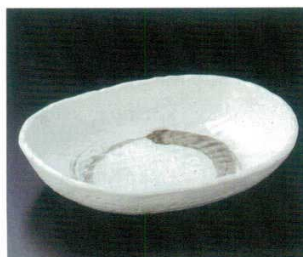
03618-259 白マット水晶刷毛目バスケット 1,050円 40入 (22.5×17.3×4cm)