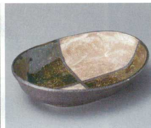
03620-199 織部格子21c楕円盛鉢 1,000円 40入 (21×15.5×5.5cm)