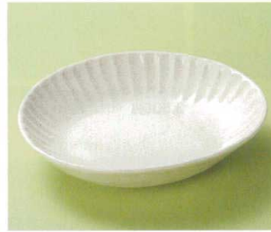
03612-319 ソギ白粉引楕円鉢(大) 2,750円 30入 (22.8×21×4.7cm)