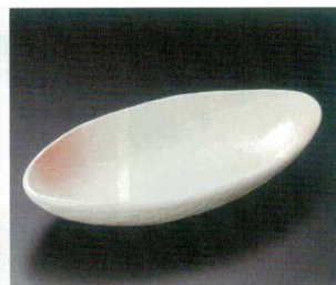
03619-309 暁白雪楕円中鉢 1,050円 30入 (24×13.5×3.5cm)