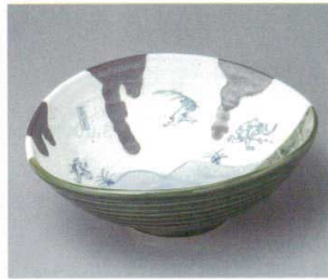
03611-109 塗分鳥獣戯画たわみ盛鉢 3,000円 30入 (21×19.5×7.5cm)