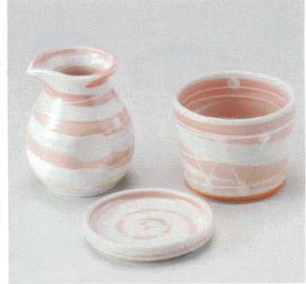
38614-449 一珍萩色うず1号そば徳利 1,830円 20×6人(7.5×9.5cm-180cc) 38615-449 一珍萩色うずそば千代口 1,550円 100人(8.8×6.5cm-200cc) 38616-449 一珍萩色うず切立薬味皿 1,100円 200人(8.8×1.5cm)