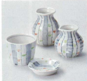
38605-179 十草そば徳利十草(大) 1,920円 80人(6.5×10cm-350cc) 38606-179 十草そば徳利(小) 1,680円 120人(5.7×8cm-230cc) 38607-179 十草そば千代久 1,170円 100人(8.3×6.5cm-230cc) 38608-179 十草小皿 860円 150人(8.6×2cm)