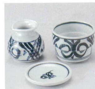
38646-409 古代唐草そば徳利 1,000円 60人(8×7.8cm-210cc) 38647-409 古代唐草そば千代久 850円 60人(9×6.5cm-270cc) 38648-409 古代唐草薬味皿 550円 100人(9.3×1.4cm)