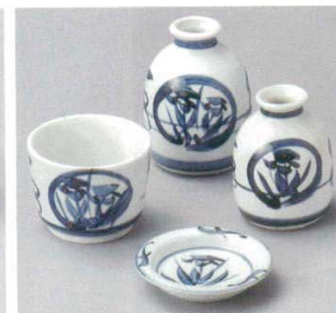
38649-039 手描花二合そば徳利 800円 40人(7.5×10.5cm-280cc) 38650-039 手描花一合そば徳利 740円 60人(6.5×9cm-200cc) 38651-039 手描花そば千代久 650円 100人(8.5×6.2cm-200cc) 38652-039 手描花そば薬味皿 430円 180人(9×1.5cm)