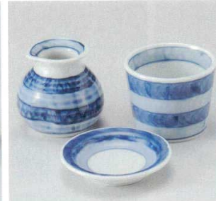
38640-139 濃独楽1号そば徳利 1,280円 80人(8×7.7cm-170cc) 38641-139 濃独楽そば猪口 990円 100人(8.2×6.7cm-180cc) 38642-139 濃独楽3.0薬味皿 650円 200人(9.5×1.9cm)