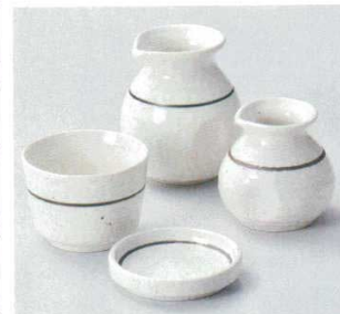
38632-029 粉引ライン2合ダシ入 1,300円 10×6人(8.5×10cm-300cc) 38633-029 粉引ライン1合ダシ入 1,100円 10×8人(8×8cm-180cc) 38634-029 粉引ラインそば千代久 600円 120人(8.5×6.3cm-180cc) 38635-029 粉引ライン丸3.0薬味皿 500円 200人(8.8×1.9cm)