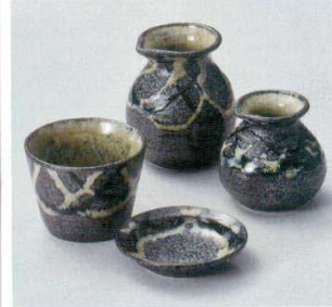
38628-109 伊賀うのふ乱十草二合そば徳利 1,300円 60人(280cc) 38629-109 伊賀うのふ乱十草一合そば徳利 1,150円 120人(180cc) 38630-109 伊賀うのふ乱十草そば千代久 1,000円 120人(8.5×6.5cm-180cc) 38631-109 伊賀うのふ乱十草ヤクミ皿 640円 200人(9×1.8cm)