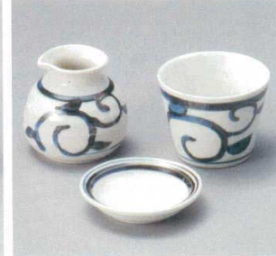
38643-189 おふけ唐草そば徳利 1,800円 10人(8×7.8cm-200cc) 38644-189 おふけ唐草そば千代口 1,100円 60人(8.5×6.5cm-180cc) 38645-189 おふけ唐草やくみ皿 700円 120人(9×1.8cm)