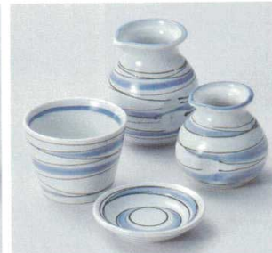
38636-179 水晶流水2人用徳利 1,200円 10×8人(7×10cm-310cc) 38637-179 水晶流水一人用徳利 1,050円 10×10人(6.5×7.5cm-180cc) 38638-179 水晶流水そば千代久 960円 150人(8.2×6.5cm-200cc) 38639-179 水晶流水やくみ皿 620円 300人(9×2cm)