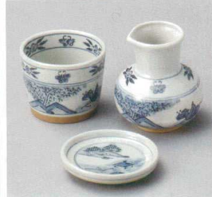
38625-549 京山水汁徳利 1,320円 80人(8.5×10cm-230cc) 38626-549 京山水そば千代口 930円 80人(8.5×7cm-200cc) 38627-549 京山水薬味皿 620円 100人(9×2cm)