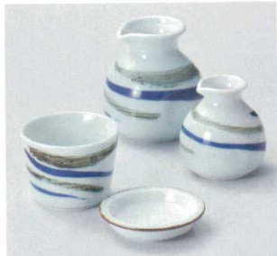
38601-299 青白磁すじ流しそば徳利(大) 2,650円 100人(9.8×10.2cm-350cc) 38602-299 青白磁すじ流しそば徳利(小) 1,850円 120人(8.5×8.2cm-200cc) 38603-299 青白磁すじ流しそば千代久 1,200円 160人(8.3×6.5cm-180cc) 38604-299 青白磁すじ流しそば薬味皿 860円 300人(8.9cm)