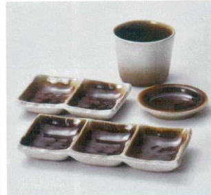
38621-559 ブラウン三品盛 1,500円 50人(19.5×9.5×2.5cm) 38622-559 ブラウン二品盛 1,100円 80人(13.3×9.3×2.5cm) 38623-559 ブラウンそば猪口 1,050円 60人(8.5×7cm-160cc) 38624-559 ブラウン薬味皿 690円 150人(9×1.5cm)