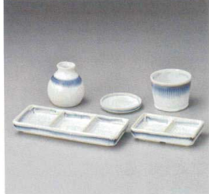
38609-149 白雲呉須流し三つ仕切皿 1,880円 40人(21×9.3×2.8cm) 38610-149 白雲呉須流しそば徳利 1,250円 60人(9×9cm-200cc) 38611-149 白雲呉須流し三つ仕切皿 1,330円 60人(12.5×7.8×2.8cm) 38612-149 白雲呉須流しそば千代口 1,180円 80人(8.5×6.5cm-180cc) 38613-149 白雲呉須流し薬味皿 630円 150人(8.5×1.5cm)