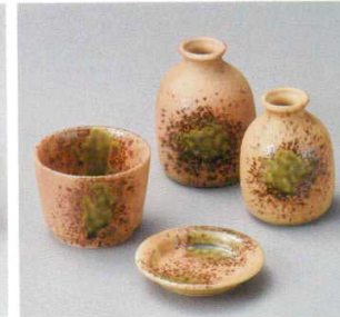
38656-039 織部吹二合そば徳利 800円 40人(7.5×10.5cm-270cc) 38657-039 織部吹一合そば徳利 740円 60人(6.5×9cm-180cc) 38658-039 織部吹そば千代久 680円 100人(8.5×6.2cm-200cc) 38659-039 織部吹薬味皿 470円 180人(9×2cm)