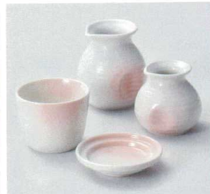
38617-459 あげほの2号徳利 1,500円 80人(8.5×10cm-325cc) 38618-459 あげほの1号徳利 1,350円 100人(7.5×8cm-200cc) 38619-459 あげほのそば 千代久 620円 120人(8.5×6.7cm) 38620-459 あげほの薬味皿 500円 200人(9×2cm)