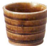
38916-269 鉄イラボそぎ型カップ 550円 80入 (8×6.5cm・170cc)