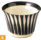
土 38909-469 黒十草そば千代口 1,700円 80入 (9.5×6.8cm・220cc)