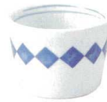
38912-409 やっこ切立そば千代口 550円 150入 (8.3×6.4cm・200cc)