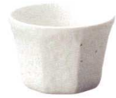
38908-029 白粉引八角そば千代久 380円 120入 (8.5×5.8cm・170cc)