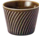
38906-319 オリベタークそば千代口 700円 120入 (8×6.3cm・190cc)