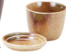
38903-029 伊賀風そば千代久 370円 120入 (8.3×6.2cm・190cc) 38904-029 伊賀風薬味小皿 300円 200入 (8.8×2cm)