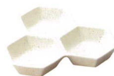
38924-589 クリーム粉引六角三角 1,020円 60入 (13.7×13.5×2.5cm)