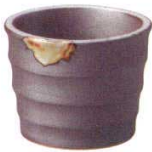
38915-269 鉄袖そぎ型カップ 550円 80入 (8×6.5cm・170cc)