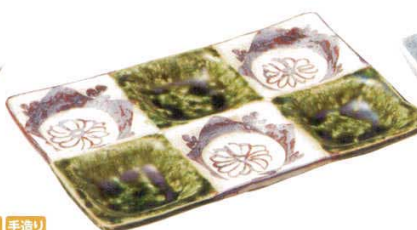
土 手造り 38929-149 織部花紋六つ仕切皿 9,000円 (25.7×17×2.3cm)