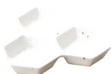
38923-589 灰釉六角三角 1,020円 60入 (13.7×13.5×2.5cm)