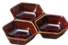
38925-589 アメ釉六角三角 1,020円 60入 (13.7×13.5×2.5cm)