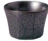
38907-029 いぶし黒八角そば千代久 380円 120入 (8.5×5.8cm・170cc)