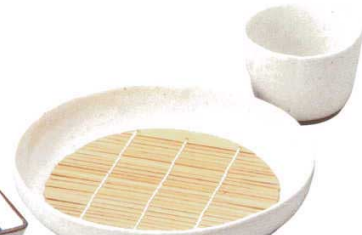
38919-579 無地白釉丸7.0浅鉢 2,000円 10入 (21×4cm) 38920-579 無地白釉そば千代久 850円 100入 (8.2×6.5cm・180cc) 38921-579 無地白釉竹入 290円 666入 (16.5cm)