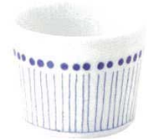
38913-199 蒼十草そば千代久 550円 100入 (8.5×7cm・230cc)