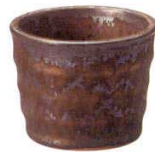
38917-269 金結晶そぎ型カップ 600円 80入 (8×6.5cm・170cc)