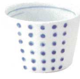
38911-409 豆しぼり切立そば千代口 550円 150入 (8.3×6.4cm・200cc)