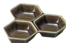
38927-589 織部六角三角 1,020円 60入 (13.7×13.5×2.5cm)