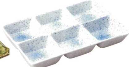
38930-439 吹清六品盛皿 4,000円 (24.8×16.5×3cm)