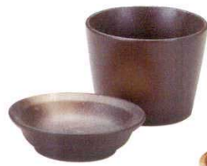
38901-209 黒備前ソバ千代久 450円 120入 (8×6.3cm・180cc) 38902-209 黒備前薬味皿 280円 200入 (8.8×2.9cm)