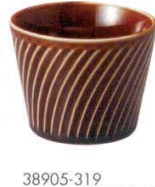
38905-319 アメタークそば千代口 700円 120入 (8×6.3cm・190cc)