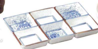
38918-149 淵錆吹き墨六つ仕切鉢 3,520円 40入 (19×12.7×2.2cm)