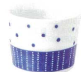
38914-199 蒼天そば千代久 550円 100入 (8.5×7cm・230cc)