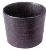
38910-029 銀鱗(ぎんりん)そば猪口 980円 100入 (8.3×6.7cm・220cc)