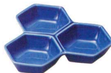
38926-589 ブルー六角三角 1,020円 60入 (13.7×13.5×2.5cm)