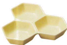
38922-589 黄マット六角三角 1,020円 60入 (13.7×13.5×2.5cm)