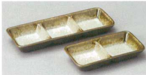
39213-579 織部かすみ三品盛(大) 1,350円 60入 (21.8×8×2.5cm) 39214-579 織部かすみ二品盛(大) 1,100円 90入 (15×7.8×2.5cm)