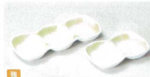
39243-559 ヒワ吹き三品盛 1,100円 80入 (20.5×9.2×2.5cm) 39244-559 ヒワ吹き二品盛 880円 150入 (13.8×9.2×2.5cm)