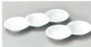
39253-469 白だんご3連皿 1,500円 60入 (26.2×9.5×2.6cm) 39254-469 白だんご2連皿 1,100円 100入 (17.8×9.5×2.6cm)