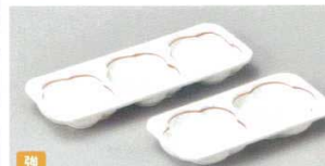
39233-559 赤ライン梅型三品盛 1,380円 120入 (26.2×9.5×2.6cm) 39234-559 赤ライン梅型二品盛 1,020円 150入 (13×6.4×1.6cm)