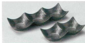
39209-439 瀬戸黒石目型豆3連皿 920円 200入 (15.1×5×2.5cm) 39210-439 瀬戸黒石目型豆2連皿 690円 200入 (10.1×5×2.5cm)