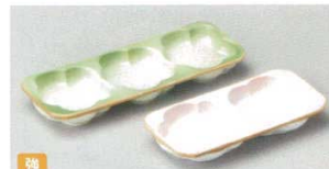
39241-549 緑翠梅型三品盛 1,380円 100入 (17×6.3×2cm) 39242-549 ピンク吹二品盛 1,250円 120入 (13×6.3×2cm)