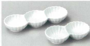
39229-439 青磁菊型三品皿 1,050円 60入 (19×6.9×2.6cm) 39230-439 青磁菊型二品皿 880円 100入 (12.9×7×2.6cm)