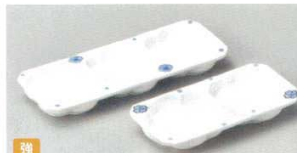
39235-549 花暦三品盛 1,380円 100入 (17×6.2×2cm) 39236-549 花暦二品盛 1,250円 120入 (13×6.2×2cm)