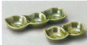
39245-579 織部木の葉三品盛 660円 129入 (17.5×6.5×2.5cm) 39246-579 織部木の葉二品盛 490円 200入 (11.8×6.5×2.5cm)