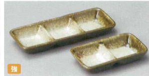
39215-579 織部かすみ三品盛(小) 1,100円 80入 (17.5×6.7×2.2cm) 39216-579 織部かすみ二品盛(小) 880円 120入 (11.7×6.5×2.2cm)