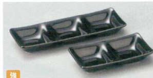
39237-579 黒三品盛 880円 100入 (20.2×6.8×2.7cm) 39238-579 黒二品盛 650円 142入 (13.5×6.8×2.7cm)