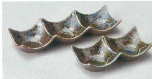
39203-439 いろり石目型3連皿(小) 1,590円 100入 (20.1×6.6×3.3cm) 39204-439 いろり石目型2連皿(小) 1,300円 120入 (13.1×6.4×2.8cm)