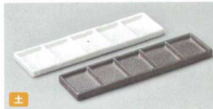
39201-459 雪志野五品珍味皿 2,700円 100入 (22.5×6×1.2cm) 39202-459 いぶし黒五品珍味皿 2,700円 100入 (22.5×6×1.2cm)