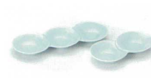
39249-469 青磁だんご3連皿 1,500円 60入 (26.2×9.5×2.6cm) 39250-469 青磁だんご2連皿 1,100円 100入 (17.8×9.5×2.6cm)