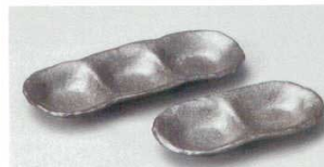
39225-459 銀天目三品皿 1,000円 60入 (18×7.5×1.7cm) 39226-459 銀天目二品皿 760円 80入 (13.5×7×1.7cm)