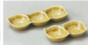
39247-579 黄瀬戸木の葉三品盛 660円 129入 (17.5×6.5×2.5cm) 39248-579 黄瀬戸木の葉二品盛 490円 200入 (11.8×6.5×2.5cm)