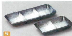
39217-559 雲海三品盛 1,390円 60入 (17.6×6.7×2.2cm) 39218-559 雲海二品盛 1,130円 80入 (11.7×6.5×2.2cm)