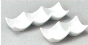
39205-439 白磁石目型3連皿(小) 1,430円 80入 (20.3×6.7×3.3cm) 39206-439 白磁石目型2連皿(小) 1,100円 100入 (13.6×6.7×3.2cm)