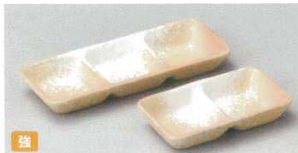
39221-589 雪どけ三品盛 1,390円 80入 (17.6×6.7×2.1cm) 39222-589 雪どけ二品盛 1,140円 120入 (11.7×6.5×2.2cm)