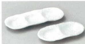
39227-459 さざ波三品皿 1,000円 60入 (18×7.5×1.7cm) 39228-459 さざ波二品皿 760円 80入 (13.5×7×1.7cm)