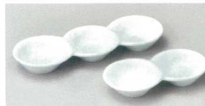
39251-469 青白だんご3連珍味 700円 150入 (18×6.2×2cm) 39252-469 青白だんご2連珍味 550円 200入 (12.2×6.2×2cm)