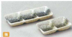
39219-559 緑川三つ仕切(小) 1,280円 80入 (17.5×6.2×2.2cm) 39220-559 緑川二つ仕切(小) 1,050円 100入 (11.9×6.2×2.2cm)