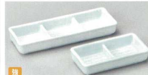
39239-579 青磁三品盛 850円 80入 (18.2×6.3×2.7cm) 39240-579 青磁二品盛 600円 120入 (12×6.3×2.7cm)