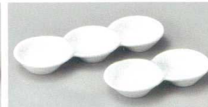
39255-469 白だんご3連珍味 700円 150入 (18×6.2×2cm) 39256-469 白だんご2連珍味 550円 200入 (12.2×6.2×2cm)