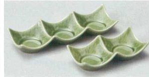
39207-559 ねり抹茶石目型3連皿(小) 1,540円 80入 (20.3×6.7×3.2cm) 39208-559 ねり抹茶石目型2連皿(小) 1,200円 100入 (13.6×6.7×3.2cm)