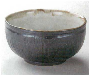
40621-149 くし目鉄黒多用丼(大) 3,000円 30入 (18×9.5cm・1,240cc) 40622-149 くし目鉄黒多用丼(小) 1,800円 50入 (14×8.5cm・680cc)