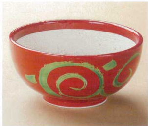
40619-449 ぐるり赤まき唐草5.5丼 3,050円 30入 (17.2×8.4cm) 40620-449 ぐるり赤まき唐草4.8丼 2,600円 36入 (15.3×7.5cm)