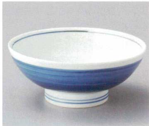
40618-259 呉須千段6.0平身丼 3,000円 50入 (18×7.5cm)