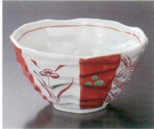
40611-149 赤絵間取波八角丼(大) 3,350円 30入 (17×9cm・850cc) 40612-149 赤絵間取波八角丼(小) 2,200円 50入 (13.5×7.3cm・450cc)