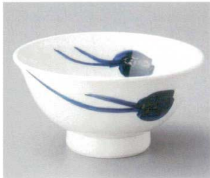
40617-259 呉須流し6.0高台丼 3,150円 40入 (17.5×8.8cm)