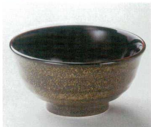
40630-059 錦天目深口6.5丼 1,800円 40入 (19.5×10cm) 40631-059 錦天目深口5.5丼 1,100円 50入 (17.5×8.5cm)