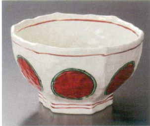
40603-189 赤絵丸紋六角6.0丼 4,850円 30入 (18×10cm) 40604-189 赤絵丸紋六角5.0丼 4,350円 30入 (15×9cm)