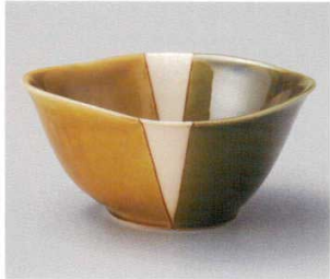
40606-579 黄瀬戸塗分多用丼 4,300円 30入 (17×16.2×8cm)