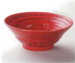
40609-189 赤ゆず刷毛7.0丼 3,900円 20入 (21.8×8.2cm) 40610-189 赤ゆず刷毛5.8丼 2,300円 30入 (17.5×8cm)