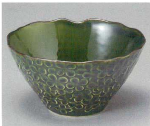
40628-109 花詰織部多用鉢 2,000円 30入 (17.3×9.2cm)