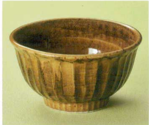
40626-199 飴斑点しのぎ5.5丼 2,700円 30入 (17.8×9.5cm) 40627-199 飴斑点しのぎ5.0丼 2,200円 40入 (15.5×9cm)