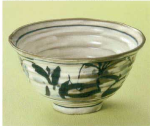
40624-189 白粉引草花反5.5丼 2,750円 30入 (17×9.2cm) 40625-189 白粉引草花反5.0丼 2,200円 30入 (15.4×8.3cm)