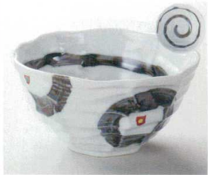
40613-149 呉須丸紋八角丼(大) 3,350円 30入 (17×9cm・850cc) 40614-149 呉須丸紋八角丼(小) 2,200円 50入 (13.5×7.3cm・450cc)