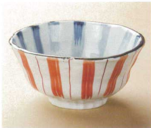
40615-259 赤絵十草変型6寸丼 3,500円 30入 (18.5×18.5×9cm・1,000cc) 40616-259 赤絵十草変型5.5丼 2,850円 40入 (17×16.5×9cm・800cc)