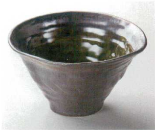
40607-149 いぶし銀彩鉢(大) 3,980円 20入 (21.5×21×12cm・1,350cc) 40608-149 いぶし銀彩鉢(小) 3,300円 30入 (20×19×10.5cm・850cc)