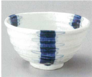
40623-179 三ツ割十草変形丼(大) 2,500円 (17×16.5×9cm)