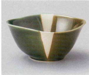
40605-579 織部塗分多用丼 4,300円 30入 (17×16.2×8cm)