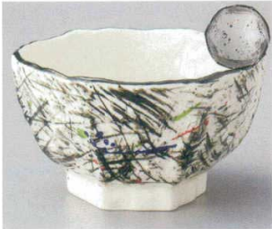
40601-149 筆なぶり六角丼(大) 4,600円 25入 (18×17.3×10.5cm・950cc) 40602-149 筆なぶりミニ丼(大) 2,900円 40入 (14.5×14×8.5cm・550cc)