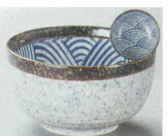
42233-179 青海波多用碗 (小) 600円 60入 (12.8×7cm)