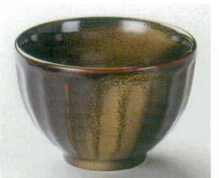
42227-209 金華削り十草4.2丼 880円 40入 (12.5×8.4cm・520cc)