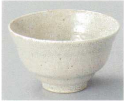
42202-519 錆かいらぎ小井 2,600円 60入 (12.8×7.7cm)