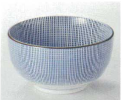
42225-199 千段十草4.1多用丼 1,100円 50入 (12.8×7cm)