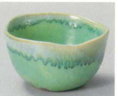
42218-269 深海マット変型多用碗 1,400円 80入 (12.7×12.7×6.8cm)