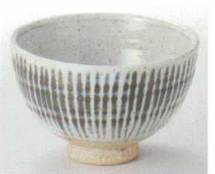
42217-589 梨地細十草雑炊碗 2,060円 80入 (12.5×8cm)