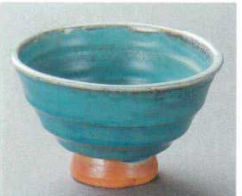
42215-269 トルコブルー4寸高浜丼 1,600円 90入 (12.1×7cm) 42216-269 トルコブルー3.5寸高浜丼 1,100円 120入 (10.6×7cm)