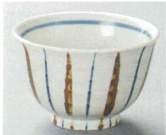
42224-189 2色トクサ4.0多用碗 1,250円 60入 (12.5×8cm)