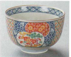
42204-739 古伊万里松竹梅お好み碗 (有田焼) 2,300円 5×16入 (12.5×8cm)