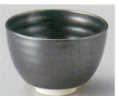
42222-459 楽釉黒軽量小井 1,320円 60入 (12.5×8.5cm・570cc)