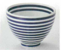
42208-199 ルリ千段ノッポ丼 (大) 1,800円 60入 (12.7×9.5cm) 42209-199 ルリ千段ノッポ丼 (小) 1,500円 80入 (11.3×8.2cm)