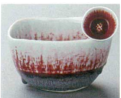
42220-269 辰砂変形多用碗 1,400円 80入 (12.7×12.7×6.8cm)