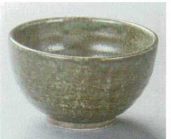
42226-029 窯変織部石目多用丼 950円 40入 (12.5×7cm)