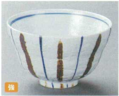
42207-139 十草4.5お好み丼 1,850円 48入 (12.6×7.7cm)