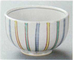
42203-319 三色十草 (小) 多用丼 2,500円 60入 (12.5×7.8cm)