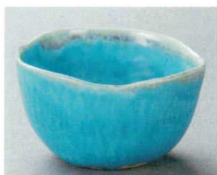
42219-269 トルコブルー変型多用碗 1,400円 80入 (12.7×12.7×6.8cm)