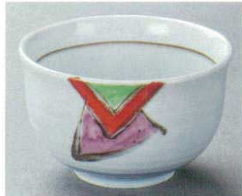
42213-149 三角紋多用丼 1,650円 50入 (12.5×8cm・510cc)