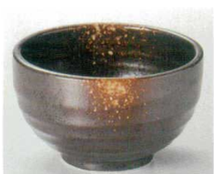
42229-339 古備前4.0多用丼 800円 60入 (12.5×7.5cm)