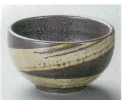
42230-179 朽葉石目4.2丼 800円 50入 (13×7.5cm)