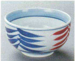
42214-149 赤絵ハの字多用丼 (小) 1,650円 60入 (12.5×7cm・460cc)