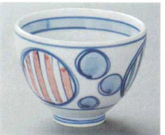
42210-199 水玉色十草ノッポ丼 (大) 1,800円 50入 (12.5×9.5cm) 42211-199 水玉色十草ノッポ丼 (小) 1,500円 70入 (11.5×8.5cm)