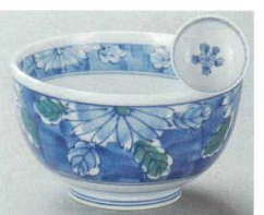
42232-199 二色だみ菊4.0京丼 750円 60入 (13×8cm)