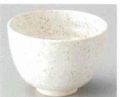
42221-459 楽釉白軽量小井 1,320円 60入 (12.5×8.5cm・570cc)