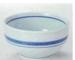
42223-149 布目呉須線 (小) 多用丼 1,050円 60入 (12.7×7cm・460cc)