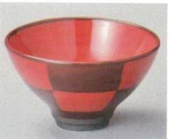
42205-259 セレン赤市松反深口4.0小井 2,000円 60入 (12.5×7.5cm)