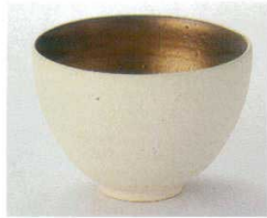
42201-669 焼び金彩中井 (信楽焼) 3,750円 50入 (12.6×8.6cm)