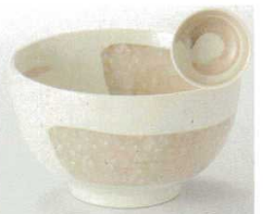
42228-189 粉引茶刷毛4.0京丼 850円 60入 (12.8×7.7cm)