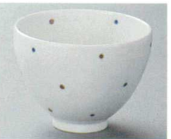
42212-199 二色水玉4.0丼 1,800円 50入 (12.7×9.7cm)