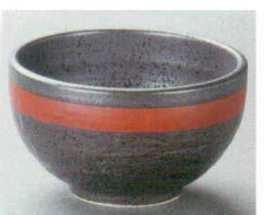
42231-209 茜石目四二丼 820円 48入 (13×7.7cm・570cc)