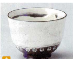
46817-449 三島大汲出し 1,650円 80入 (9.2×7cm・250cc)