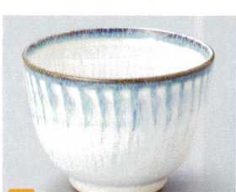
46821-449 窯変流十草汲出し大 1,650円 80入 (9.2×7cm・220cc)