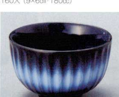
46829-579 オーロラ菊型煎茶 400円 100入 (8.8×5.4cm・150cc)