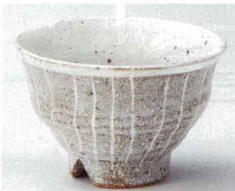
46813-519 唐津白盛十草切高台煎茶 2,000円 60入 (11×7.2cm・250cc)