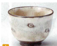
46820-449 かいらぎ印花大汲出し 1,500円 80入 (9.2×7cm・210cc)