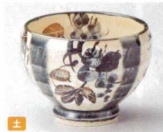
46806-279 間取藍ぶどうゆつたり碗 2,500円 60入 (10×7cm・320cc)