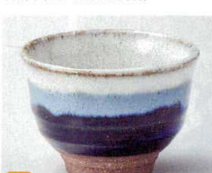
46824-029 雪間煎茶 1,250円 160入 (9×6cm・180cc)