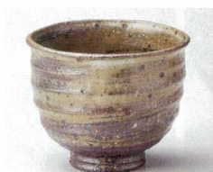
46816-669 灰桶刷毛目汲出し (信楽焼) 1,950円 120入 (9.5×8cm・260cc)