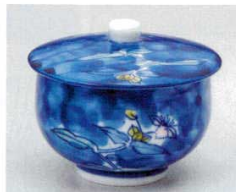
46804-549 タミ露草蓋付煎茶 1,500円 80入 (8.3×7.4cm・180cc)