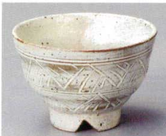
46808-519 黄粉引三島切高台煎茶 2,200円 60入 (10.7×7.3cm・250cc)