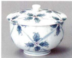
46802-549 千両蓋付煎茶 1,550円 80入 (8.2×7cm・180cc)