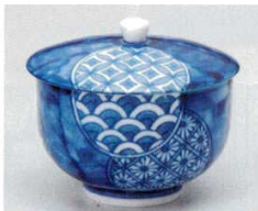
46803-549 京祥瑞蓋付煎茶 1,500円 80入 (8.2×7.4cm・180cc)