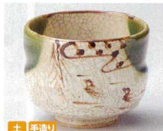
46815-519 織部ツバメ汲出し (手造り) 2,000円 80入 (8.5×6cm・230cc)