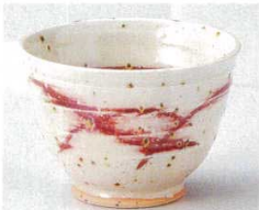
46812-669 赤絵汲出し (信楽焼) 2,100円 100入 (10×7.5cm・250cc)