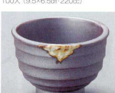
46830-269 鉄袖高浜煎茶 550円 90入 (8.7×6.3cm・170cc)