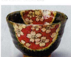
46825-589 織部舞桜煎茶 1,020円 100入 (9.5×6.5cm・220cc)