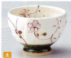
46809-279 織部花唐草ゆつたり碗 2,350円 60入 (10×7cm・320cc)