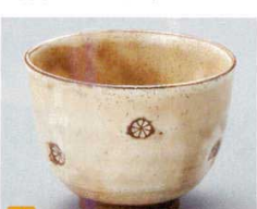
46822-449 新粉引印花大汲出し 1,500円 80入 (9.2×7cm・210cc)