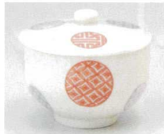
46801-549 源氏丸紋蓋付煎茶 1,550円 80入 (8.3×7.4cm・180cc)