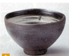
46818-519 黒陶煎茶 1,500円 80入 (9.5×6.3cm・220cc)