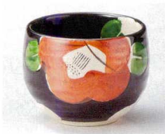
46807-579 色絵天目椿 玉煎茶 2,500円 105入 (8.3×6.5cm・230cc)