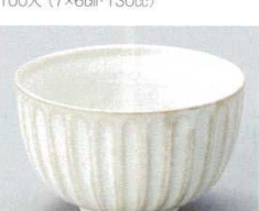
46828-579 粉引菊型煎茶 400円 100入 (8.8×5.4cm・150cc)