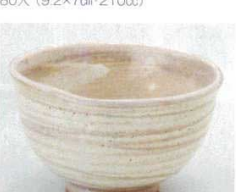
46827-319 粉引刷毛目煎茶 850円 140入 (9×5.2cm・150cc)