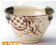
46814-519 織部つた天目煎茶 2,000円 120入 (9.8×6.5cm・240cc)