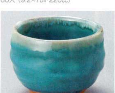
46826-269 トルコブルー六兵衛煎茶 800円 80入 (8.4×8.4×6.1cm・180cc)