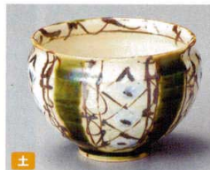
46810-279 織部ベルシャ紋ゆつたり碗 2,600円 60入 (10×7cm・320cc)