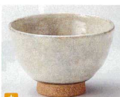
46819-519 ひすい煎茶 1,450円 100入 (10×6.5cm・250cc)