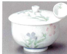
46805-549 なでしこ蓋付煎茶 1,500円 80入 (8.3×7.4cm・180cc)