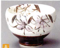
46811-279 アメ袖花紋ゆつたり碗 2,350円 60入 (10×7cm・320cc)