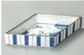
05216-149 染付山水菱形向付 3,550円 40入 (24×13.7×3.6cm)