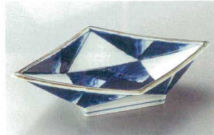
05210-149 濃菱型向付 4,250円 40入 (26.5×20.3×5.5cm)