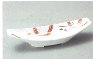
05214-479 朱刷毛目金彩舟型向付 3,800円 (29.3×10.1×6cm)