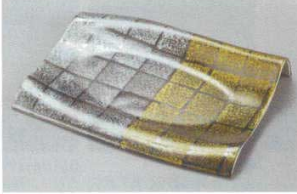
05204-179 瓦型 金銀市松向付 5,300円 (25×19×3.5cm)