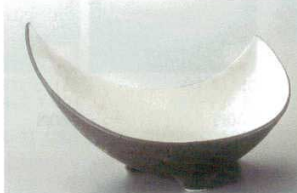
05212-139 雲母銀三日月鉢 3,950円 40入 (22.5×11×12cm)