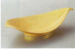
05208-149 金彩葉型8.5向付 4,750円 40入 (25.5×15×5.6cm)