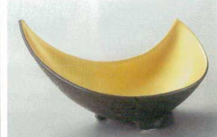
05213-139 雲母金三日月鉢 3,950円 40入 (22.5×11×12cm)