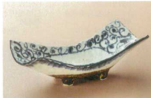
05220-149 たこ唐草足付長皿 3,100円 40入 (24.7×10.5×8cm)