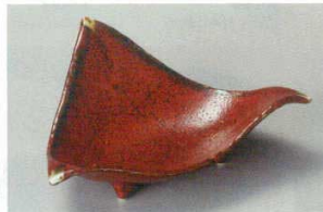
05224-149 紅柚子天目三角向付 2,800円 40入 (23×17.7×7.8cm)