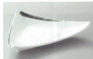
05222-149 瀬プラチナ三角向付 3,100円 50入 (23.3×14×4.7cm)