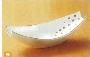
05211-589 金吹雪向付 4,020円 60入 (22.8×10×7cm)