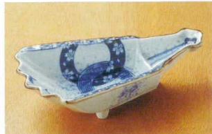
05215-179 染付春秋丸紋半開扇型向付 3,650円 40入 (22.3×11.8×5.5cm)