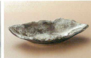
05225-459 梅花皮 黒ちぎり角中鉢 2,100円 40入 (23.4×14.5×4.7cm)