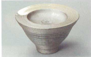
05201-669 黒窯変刷毛目7.4高台皿(信楽焼) 11,000円 12入 (22.4×13.2cm) 05202-669 黒窯変刷毛目6.0高台皿(信楽焼) 6,000円 18入 (18.2×10.7cm)