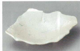
05223-479 銀河一珍菱葉向付 3,500円 30入 (24×19.5×5.2cm)