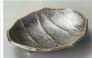
05217-149 孔雀じゃばら浅皿 3,400円 40入 (23.5×19×4.8cm)