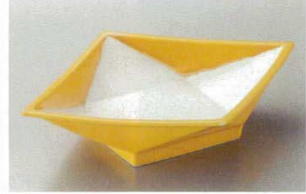
05205-149 黄釉ラスター菱型向付 4,700円 40入 (26.5×20×5cm)