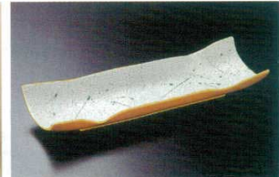
05221-179 黄釉緑散ラスター笹舟向付 3,000円 40入 (28.2×9×3.6cm)