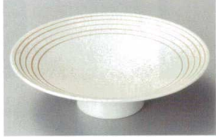
05207-479 銀河金線高台向付 4,500円 20入 (23×6.3cm)