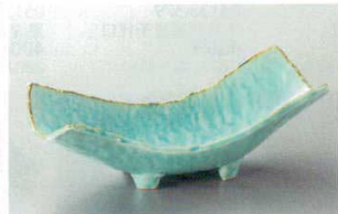
05219-139 瀬鍔マリンブルー一両上り向付 3,180円 50入 (24.7×10.6×8.5cm)