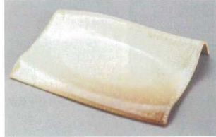
05206-469 黄地窯変ウエーブ前菜皿 4,500円 (25×20×4cm)