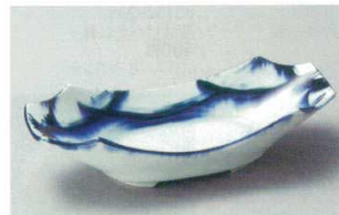
05218-579 呉須刷毛目舟形向付 3,200円 40入 (23.5×10×6cm)