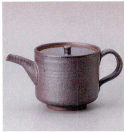
55902-669 南蛮手付ダシ入 (信楽焼) 6,300円 40入 (18×10.5×10cm・500cc)