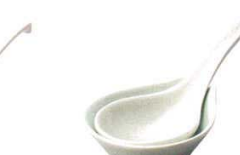
55954-659 青地大レンゲ (萬古焼) 1,000円 120入 (21×7.6cm) 55955-659 青地大受台 (萬古焼) 820円 120入 (11.8×9.8cm)