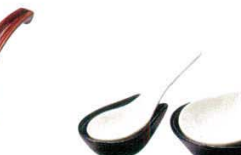
55948-659 白小レンゲ (萬古焼) 300円 320入 (14×4cm) 55949-659 黒小受台 (萬古焼) 300円 320入 (8×5cm) 55950-649 白おたま (萬古焼) 500円 200入 (19×7.2cm) 55951-649 黒丸受台 (萬古焼) 500円 200入 (10.2×8.3×3.4cm)