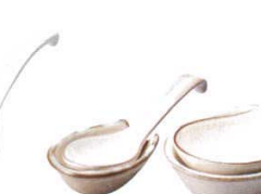
55939-Y9 京粉引大受台 (萬古焼) 800円 120入 (11.5×10×3.7cm) 55940-Y9 京粉引大レンゲ (萬古焼) 1,600円 120入 (22cm) 55941-Y9 京粉引小受台 (萬古焼) 500円 240入 (9×7×3.5cm) 55942-Y9 京粉引小レンゲ (萬古焼) 1,300円 240入 (15.8cm)