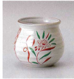
55910-649 間取赤絵アラ入 (萬古焼) 4,000円 6×6入 (11.8×12cm)