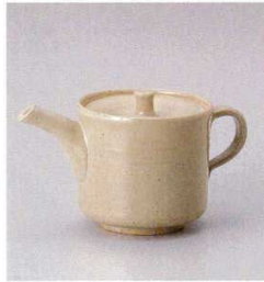
55907-669 灰釉手付ダシ入 (信楽焼) 6,300円 40入 (18×10.5×10cm・500cc)