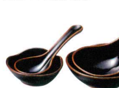
55911-659 柚子天目小レンゲ (萬古焼) 1,050円 200入 (15.8×5.5cm) 55912-659 柚子天目小受台 (萬古焼) 750円 200入 (9×9×3cm) 55913-659 柚子天目大レンゲ (萬古焼) 1,250円 100入 (23×9.3cm) 55914-659 柚子天目大受台 (萬古焼) 850円 100入 (12×11.2×4cm)