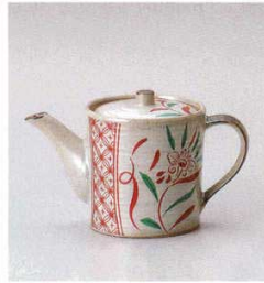
55909-649 間取赤絵汁次 (大) (萬古焼) 5,500円 6×4入 (11×14cm・830cc)