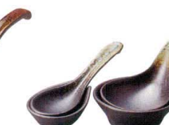
55931-649 嵯峨野小レンゲ (萬古焼) 550円 400入 (15.4×4.7cm) 55932-649 嵯峨野小受台 (萬古焼) 380円 400入 (8.8×6.6×3cm) 55933-649 嵯峨野大レンゲ (萬古焼) 950円 160入 (20.3×7.6cm) 55934-649 嵯峨野大受台 (萬古焼) 680円 160入 (11×9.3×4cm)