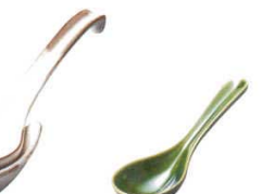
55943-649 織部小レンゲ (萬古焼) 550円 480入 (14.9×5cm)