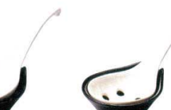
55952-659 白穴あきレンゲ (萬古焼) 500円 160入 (19×7.2cm) 55953-659 黒受台 (穴明用) (萬古焼) 500円 160入 (10.2×8.3cm)