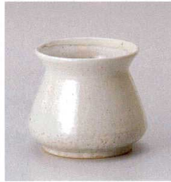
55908-669 灰釉ガラ入 (信楽焼) 3,400円 40入 (12×12×11cm・500cc)