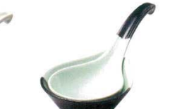
55956-659 さび掛大レンゲ (萬古焼) 1,000円 120入 (21×7.6cm) 55957-659 さび掛大受台 (萬古焼) 820円 120入 (11.8×9.8cm)