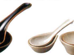
55915-659 カンゲン小レンゲ (萬古焼) 530円 240入 (15.4×4.7cm) 55916-659 カンゲン小受台 (萬古焼) 350円 240入 (8.8×6.6cm) 55917-659 カンゲン大レンゲ (萬古焼) 900円 120入 (20.3×7.6cm) 55918-659 カンゲン大受台 (萬古焼) 630円 120入 (11×9.3cm)