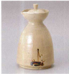
55906-669 灰釉杵形ダシ入 (信楽焼) 6,300円 30入 (11×11×20cm・700cc)