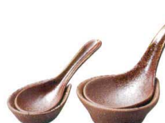
55927-649 南蛮織部小レンゲ (萬古焼) 550円 400入 (15.4×4.7cm) 55928-649 南蛮織部小受台 (萬古焼) 380円 400入 (8.8×6.6×3cm) 55929-649 南蛮織部大レンゲ (萬古焼) 950円 160入 (20.3×7.6cm) 55930-649 南蛮織部大受台 (萬古焼) 680円 160入 (11×9.3×4cm)