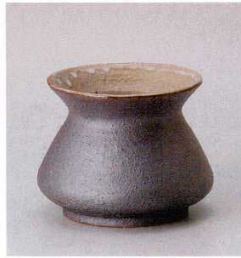
55903-669 南蛮ガラ入 (信楽焼) 3,400円 40入 (12×12×11cm・500cc)