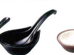
55923-659 粉引小レンゲ (萬古焼) 1,100円 200入 (6.5×14.5cm) 55924-659 粉引小受台 (萬古焼) 1,100円 200入 (9×3cm) 55925-659 粉引大レンゲ (萬古焼) 1,500円 100入 (7×20cm) 55926-659 粉引大受台 (萬古焼) 1,500円 100入 (10×3.5cm)