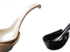
55919-649 黒釉小レンゲ (萬古焼) 550円 240入 (15×5cm) 55920-649 黒釉小受台 (萬古焼) 500円 240入 (8.7×6.3cm) 55921-659 黒釉大レンゲ (萬古焼) 1,000円 120入 (21×7.6cm) 55922-659 黒釉大受台 (萬古焼) 820円 120入 (11.8×9.8cm)