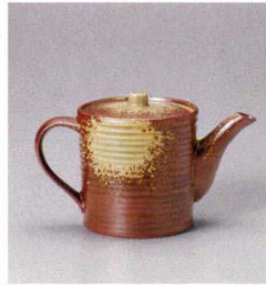
55904-649 灰釉汁次 (中) (萬古焼) 3,750円 6×6入 (10.5×12cm・570cc)