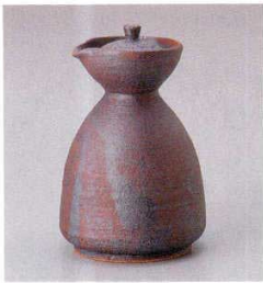
55901-669 南蛮杵形ダシ入 (信楽焼) 6,300円 30入 (11×11×20cm・700cc)