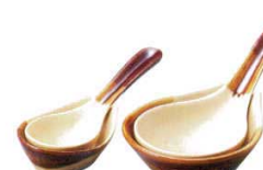
55944-Y9 だんらん小レンゲ (萬古焼) 550円 240入 (14.9×5cm) 55945-Y9 だんらん小受台 (萬古焼) 500円 240入 (8.7×6.3×2.8cm) 55946-Y9 だんらん大レンゲ (萬古焼) 1,000円 120入 (21×7.6cm) 55947-Y9 だんらん大受台 (萬古焼) 820円 120入 (11.8×9.8×3.7cm)