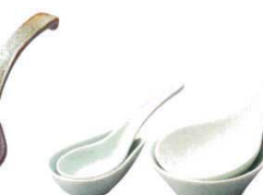
55935-649 青地小レンゲ (萬古焼) 320円 480入 (14×4cm) 55936-649 青地小受台 (萬古焼) 320円 300入 (8×5×2.4cm) 55937-649 青地おたま (萬古焼) 520円 200入 (19×7.2cm) 55938-649 青地丸受台 (萬古焼) 520円 200入 (10.2×8.3×3.4cm)