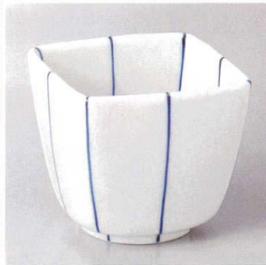
103-6-23H 3,050円 紺筋角小鉢 7.9×7.9×7.1cm