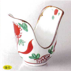
強化 103-2-78H 3,250円 赤絵間取小鉢 10.9×10.3×6.3cm