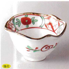
強化 103-13-78H 2,880円 赤絵花紋小鉢 8.5×6.2×8.3cm