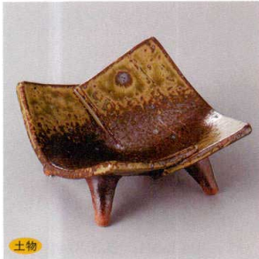
土物 103-1-45H 2,600円 トシ×双袖小付小鉢(手造) 9.5×10×5cm