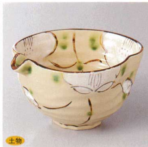
土物 103-10-22H 2,500円 格子花片口4.0小鉢 13.8×13×7cm