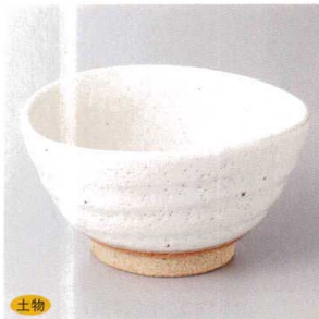
土物 103-9-45H 2,500円 粉引|変形中鉢 14×12×7.3cm