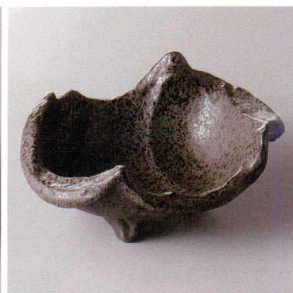
103-20-27H 2,000円 炭化土千段小鉢(小) 14×11.2×5cm