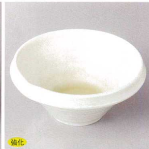
強化 103-8-56H 2,500円 黄白磁片口小鉢 13.5×13×6cm