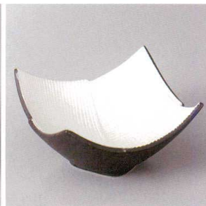
103-16-27H 2,400円 銀彩スシ入正角小鉢(小) 10.2×10.2×6cm