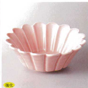
強化 103-19-79H 2,060円 ピンク菊花4.5反小鉢 13.5×5.3cm