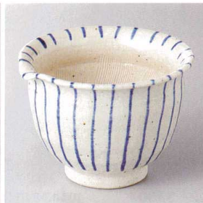
103-11-56H 2,450円 青十草反片口スリ小鉢 11.5×11.5×8.7cm