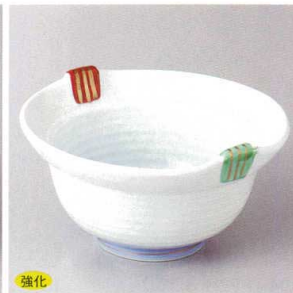
強化 103-12-22H 2,400円 コノハ吹二色小鉢 12.2×6.7cm