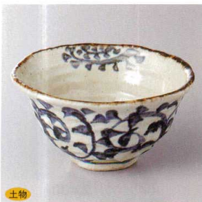
土物 103-17-23H 2,250円 タコ唐草反型小鉢 12.5×13.3×7cm