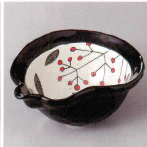
103-7-23H 3,050円 黒織部南天片口ひざこ鉢 15.2×11.8×7.1cm