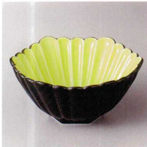
103-5-22H 2,700円 外黒グリーン釉菊彫六角小鉢 13×12.5×6cm