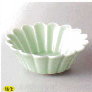
強化 103-18-71H 2,060円 ヒツ菊花4.5反小鉢 13.5×5.3cm