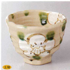
土物 103-14-23H 2,450円 白格子花深口小鉢 11.2×8.5cm