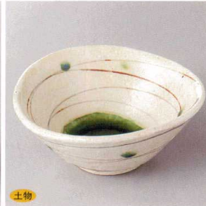
土物 103-3-2H 2,550円 コマ筋たわみ小鉢 13.7×12.3×5.7cm