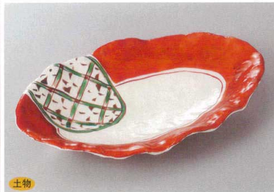
208-11-23H 4,650円 赤絵緑格子花型楕円皿 26.5×16.1×4.5cm