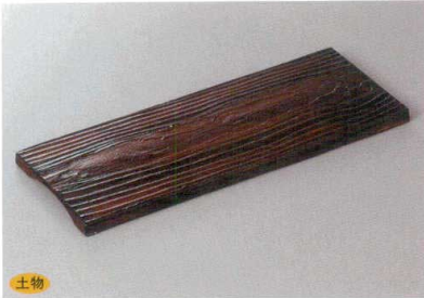
208-1-35H 4,500円 槐 enju木目皿 32×12×1.5cm