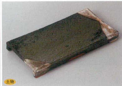
208-15-35H 4,000円 かのごまな板皿 26×13×3cm