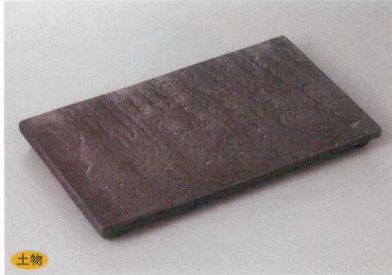
208-2-1H 4,500円 黒陶板9寸長角皿 27×16.3×2.3cm