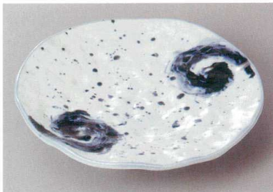
208-10-23H 4,250円 潮騒鳴門高台皿 18.3×3.5cm