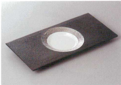
208-7-35H 4,700円 黒釉ホールプラチナ長角皿 28.7×13.8×1.8cm