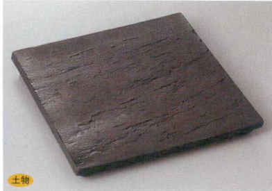
208-3-1H 4,500円 黒陶板7寸正角皿 21×21×2.3cm