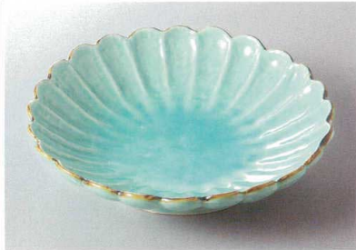
208-9-27H 4,260円 マリンブルー-湖鏡菊型皿(大) 23.7×5.4cm