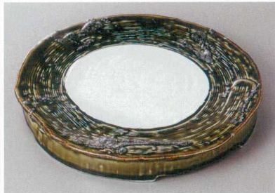
208-12-35H 4,200円 糸根織部7.5丸高台盛皿 22.5×3.2cm