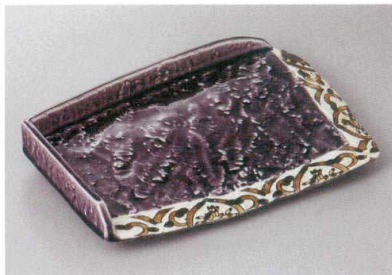
208-5-23H 7,000円 紫釉岩肌ペルシヤ紋前菜皿 26.8×18.4×4.3cm