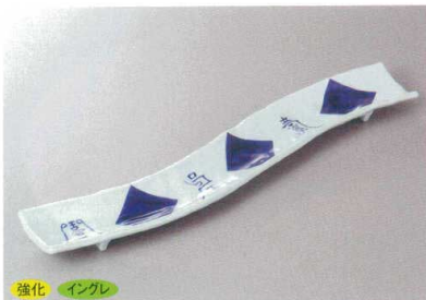
208-4-5H 4,420円 強化 イングレ 染付寿づくし細長皿 40×6.5×2.4cm