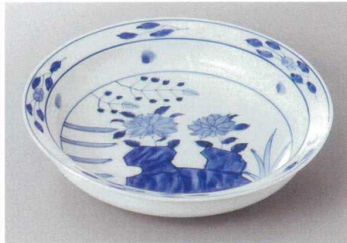
208-8-35H 4,300円 岩牡丹兜鉢(大) 20.9×4.8cm