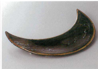
208-14-24H 4,800円 糸根織部三日月前菜 32.3×12×2.7cm