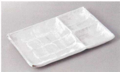
266-6-71H 1,900円 うのふ仕切皿 23.8×14.5×2.2cm