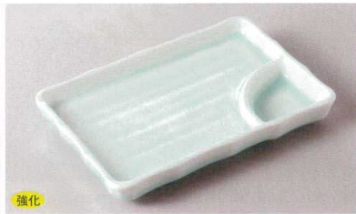
強化 266-17-79H 1,450円 青白磁70長角仕切皿 18.5×12.9×2.3cm