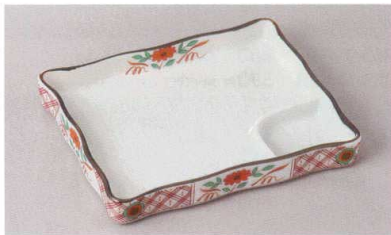
266-8-51H 1,850円 七宝菊仕切皿 17.5×14.2×2.5cm