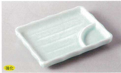
強化 266-18-79H 900円 青白磁5.5長角仕切皿 13.6×10.7×1.9cm