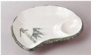
266-10-21H 1,600円 グリーン淡雪雲型仕切皿 22×17×4cm