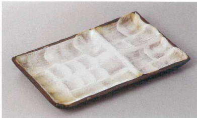
266-3-71H 2,100円 備前志野仕切皿 23.5×14.5cm