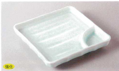
強化 266-16-79H 1,600円 青白磁正角仕切皿 16.2×16.2×2.8cm