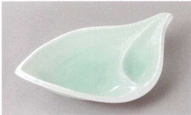
266-2-27H 2,500円 測ラスターヒツ歌レフ千代久付鉢 23×13.5×4.5cm