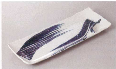
266-14-1H 1,550円 粉引ゴス刷毛仕切皿 31.6×12×1.7cm