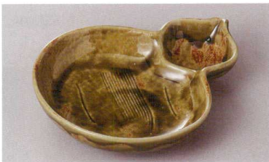
266-7-10H 1,900円 織部ライン流しひさで仕切皿 20.5×16.2×3.7cm