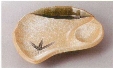
266-11-21H 1,600円 石焼織部笹雲型仕切皿 22×17×4cm