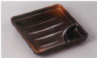
266-9-77H 1,650円 焼締め正角仕切皿 16.7×16.7×3cm