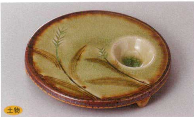
土物 266-1-23H 3,300円 美濃伊賀タレ付円台皿 60入 18.7×2.5cm