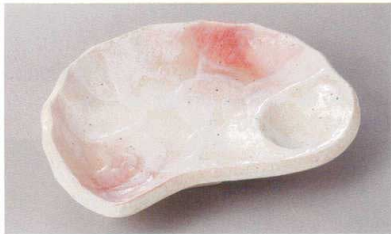
266-12-60H 1,600円 桜志野貝型仕切皿 22×17×4cm