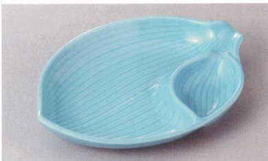
266-4-77H 2,000円 トルコ葉形仕切皿 23.3×16.3×4cm