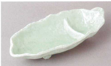
266-13-33H 1,730円 もえぎハーモニー鉢 22×10cm