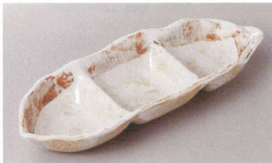
266-5-71H 2,000円 志野たきそら豆三品皿 27.3×9.6×4cm