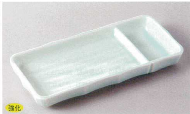
強化 266-15-79H 1,250円 青白磁付仕切皿 20×9.2×2.2cm